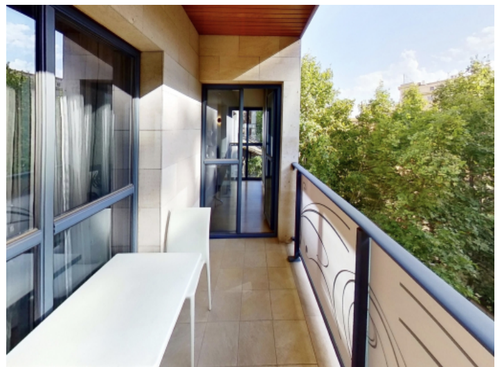
Überdachter Balkon mit Süd-West-Ausrichtung