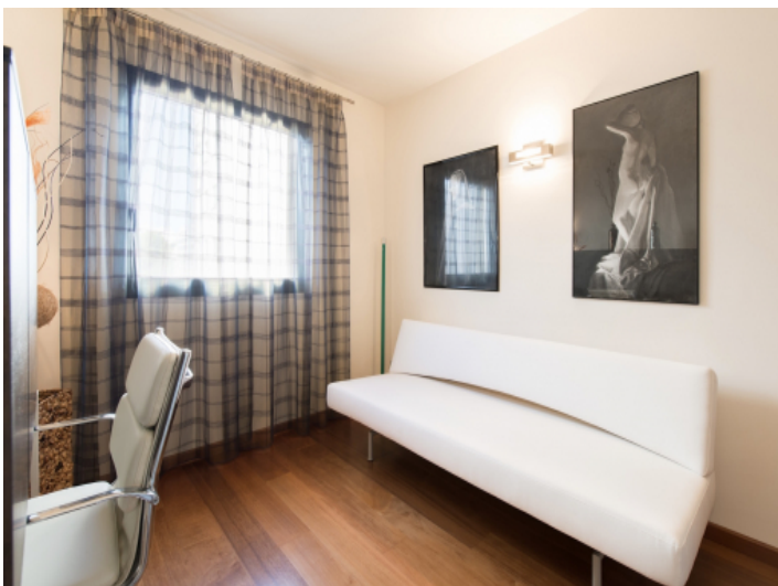
Drittes Schlafzimmer und Büro