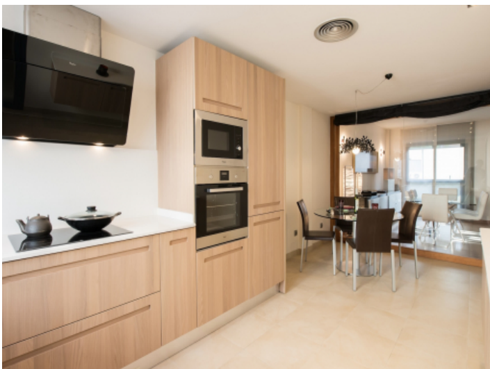
Offen gestaltete Küche