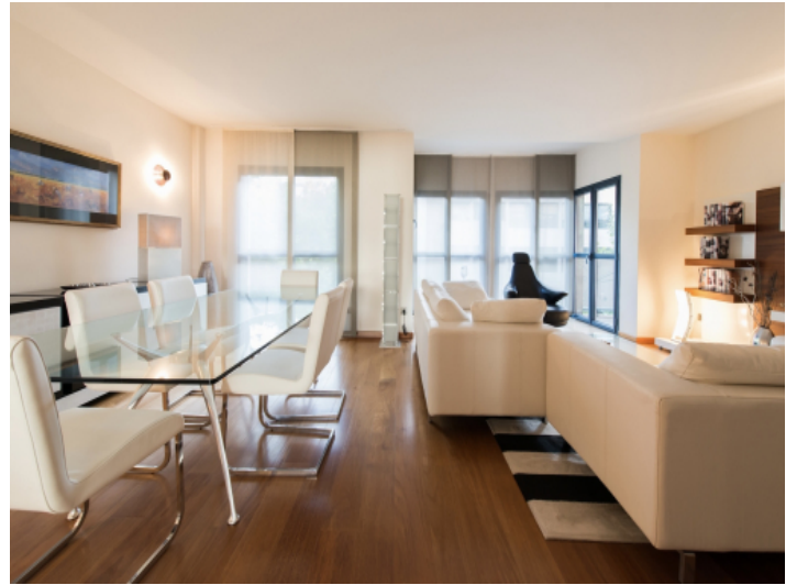
Großzügiges Wohn- und Esszimmer