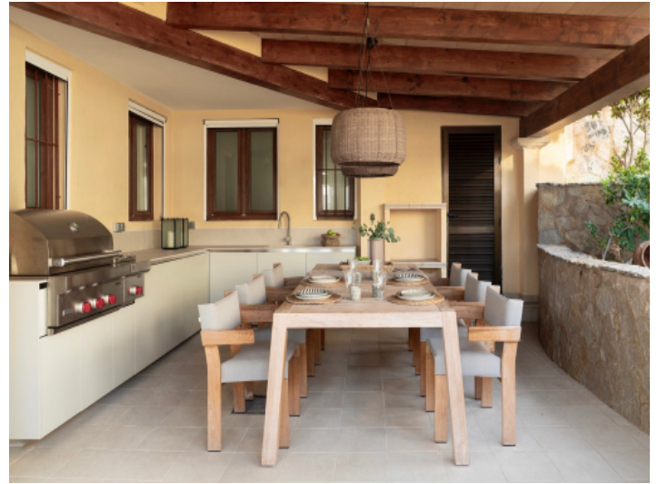
Überdachte Terrasse mit voll ausgestatteter Außenküche