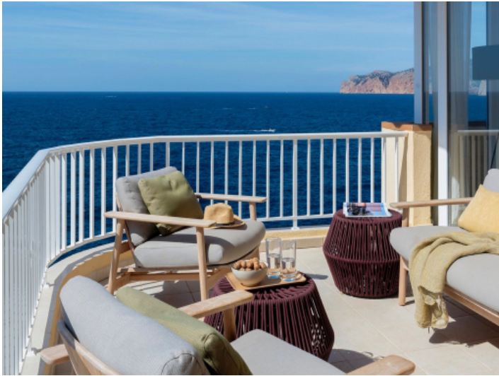
Terrasse mit herrlichem Meerblick