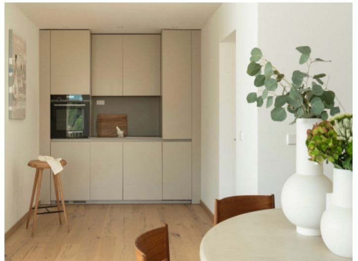
Geschmackvoll eingerichtete Küche