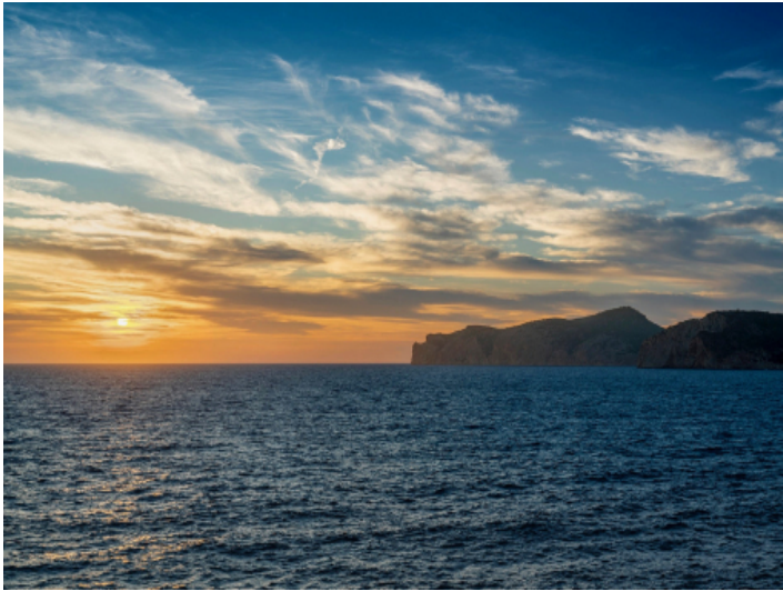
Beeindruckender Sonnenuntergang über dem Meer