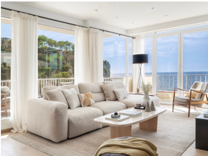
Lichtdurchfluteter Wohnbereich mit Blick auf das Meer