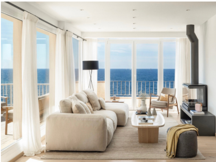
Wohnbereich mit beeindruckendem Ausblick auf das