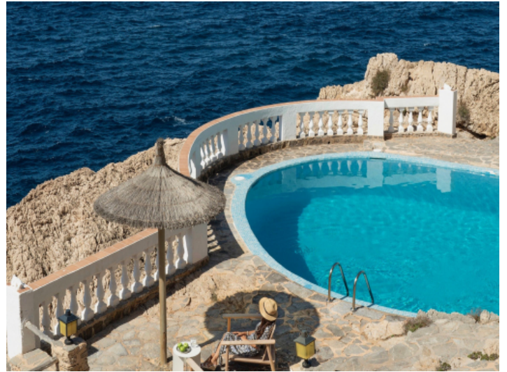
Gemeinschaftspool direkt am Meer mit Panoramablick