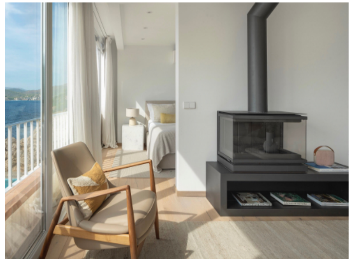
Offener Wohnbereich mit gemütlichem Kamin