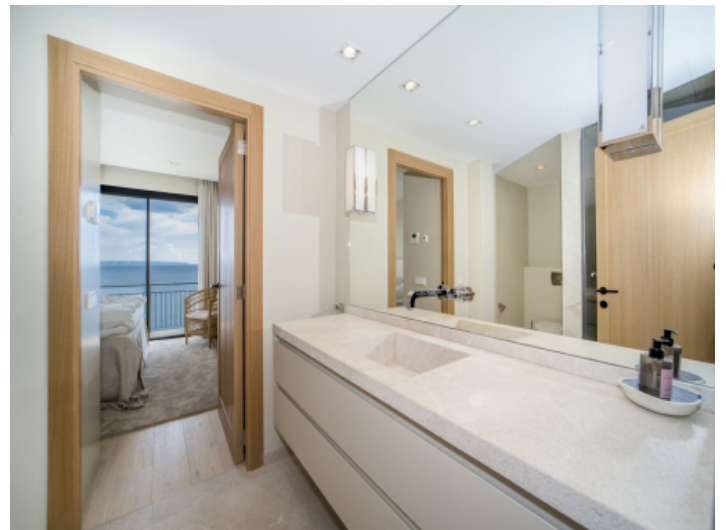
Badzimmer en Suite