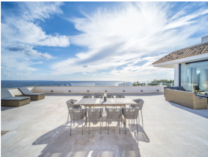
Dachterrasse mit Meerblick