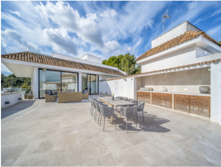
Dachterasse mit Aussenküche