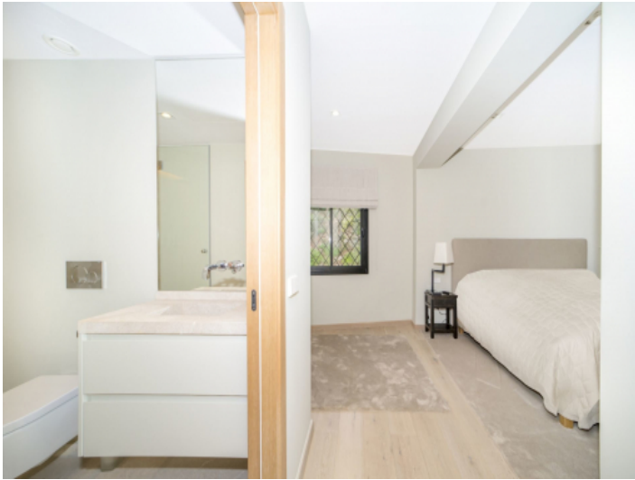
Schlafzimmer mit en Suite Badezimmer