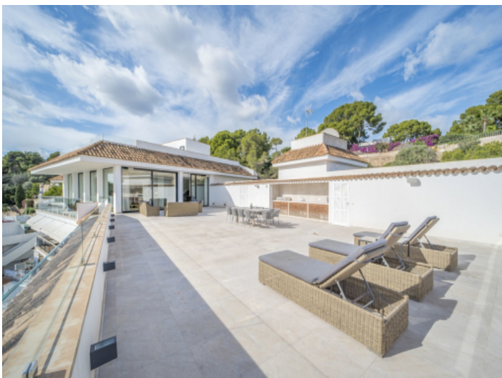
Dachterrasse mit Aussenkücheu