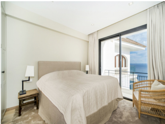
Eines von 4 Badezimmern