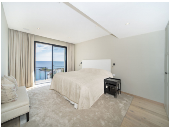
Ein weiteres Schlafzimmer