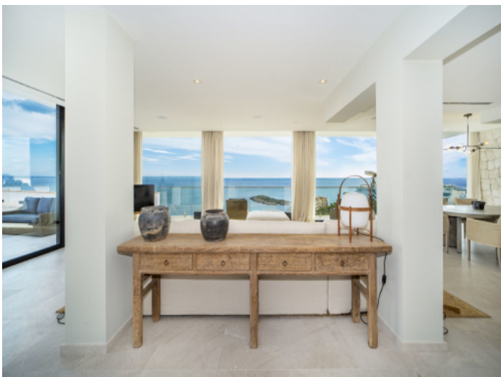
Wohnbereich mit frontalem Meerblick