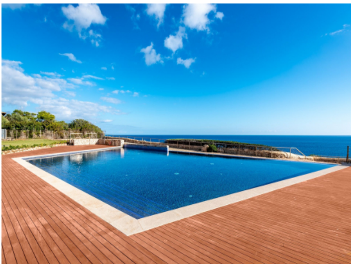
Pool in erster Meereslinie