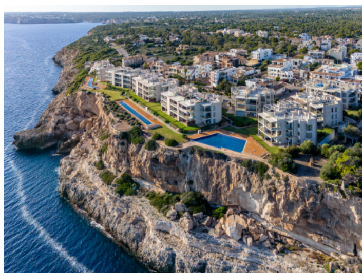
Blick aus der Vogelperspektive