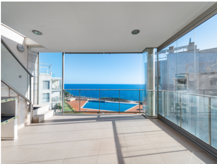
Wunderschöne, überdachte Terrasse