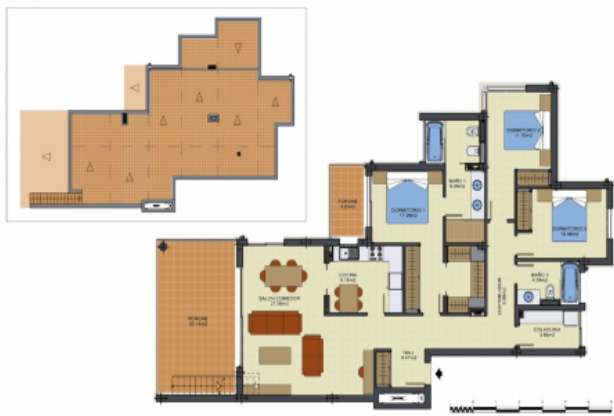
Edificio 4, Planta Piso 2º, Puerta A

SUPERFICIE ÚTIL TOTAL 107,80m 2 SUPERFICIE CONSTRUIDA CÁMERA TOTAL 100,00m 2 SUPERFICIE PISCINA 20,00m 2 SUPERFICIE SOLARUM 114,00m 2