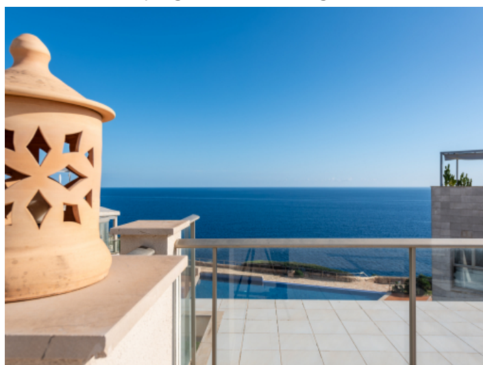
Dachterrasse mit frontalem Meerblick