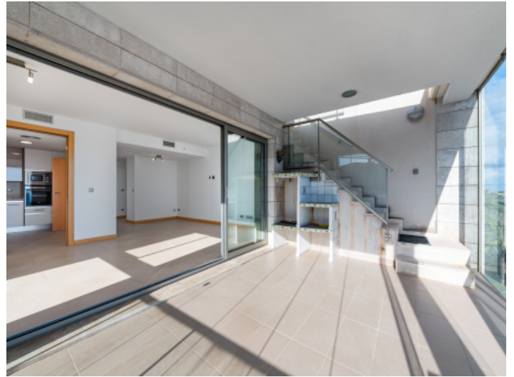
Überdachte Terrasse vor dem Wohnbereich