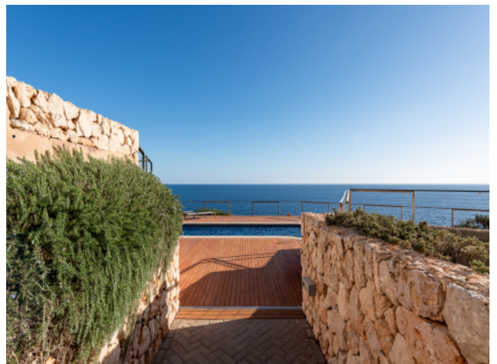
Schöner Weg zum Pool