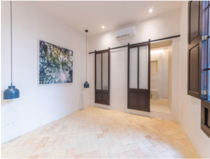
Das 2. Badezimmer