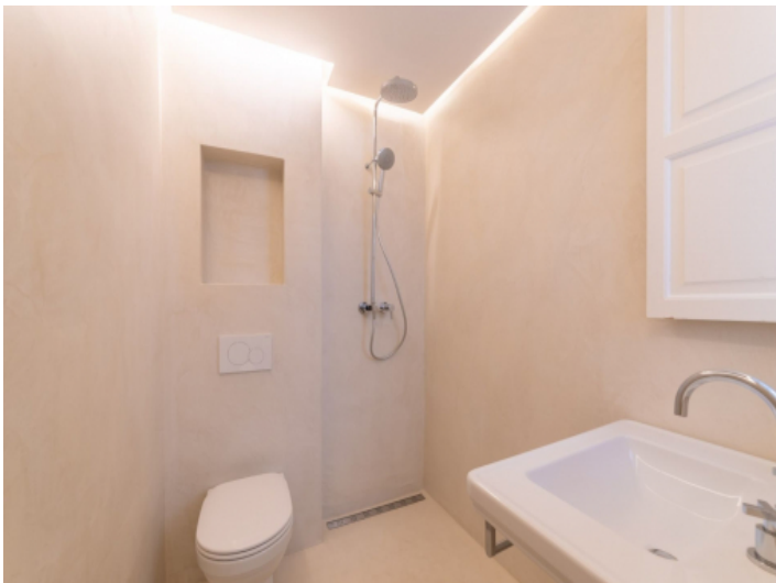
Wohnung mit 2 Badezimmern