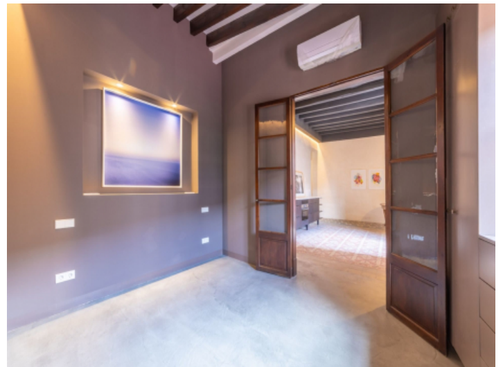
Eines von 2 Schlafzimmern