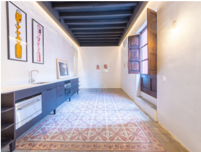
Wohn- und Essbereich