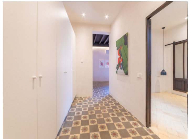
Flur mit großer Schrankwand