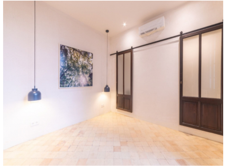
Das 2. Schlafzimmer