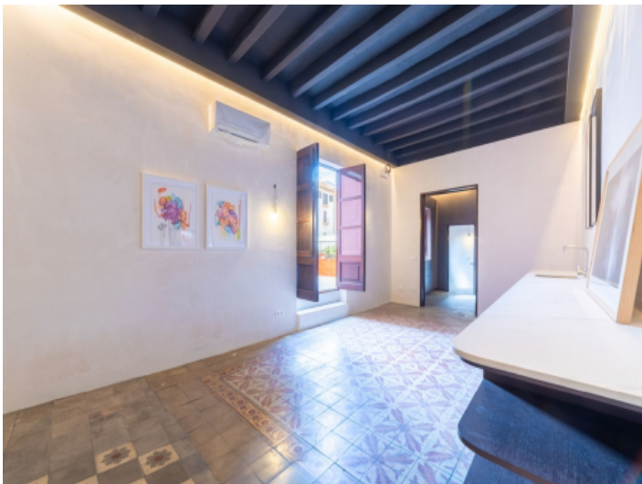
Wohn- und Essbereich