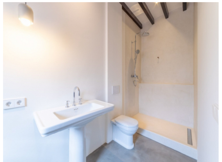
En Suite Badezimmer