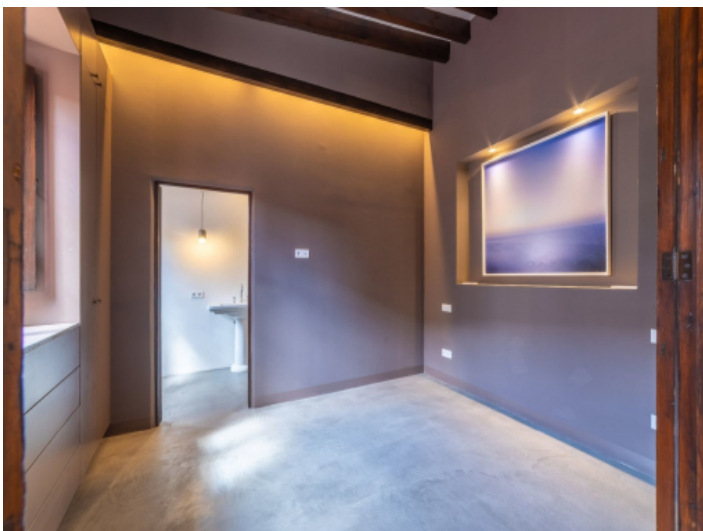
Schlafzimmern mit Badezimmern en Suite