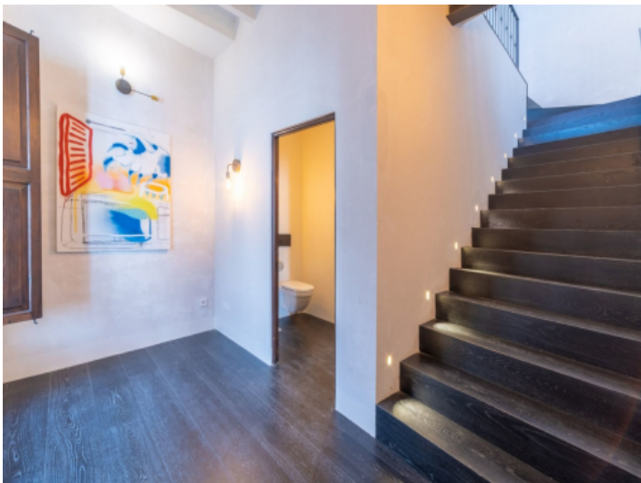
Eingangsbereich mit Treppenhaus und Gäste WC