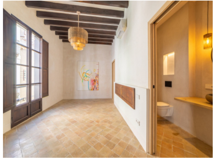
Schlafzimmer mit Altstadt-Charme