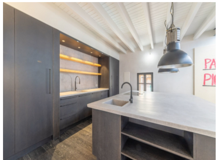
Küche mit viel Stauraum