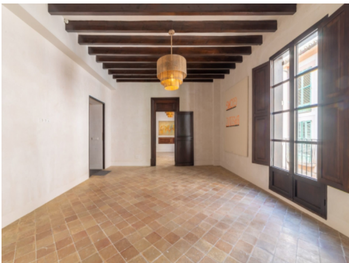
Originale Holzbalken und Fliesen