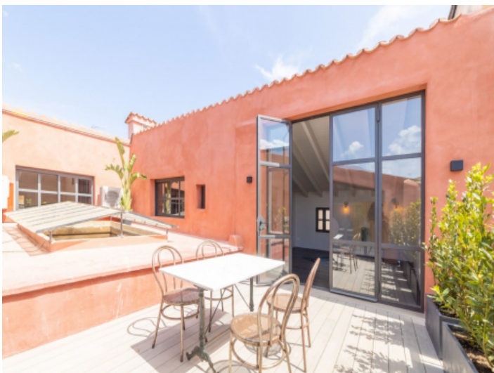
Esstisch im Freien