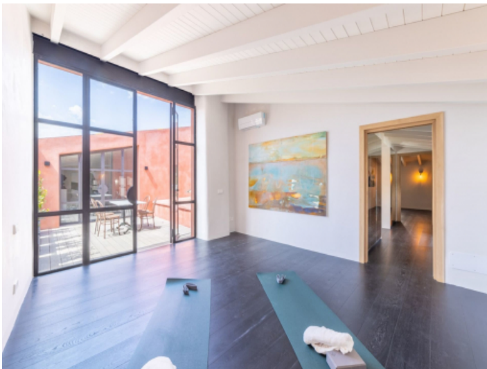
Fitness oder Büroraum