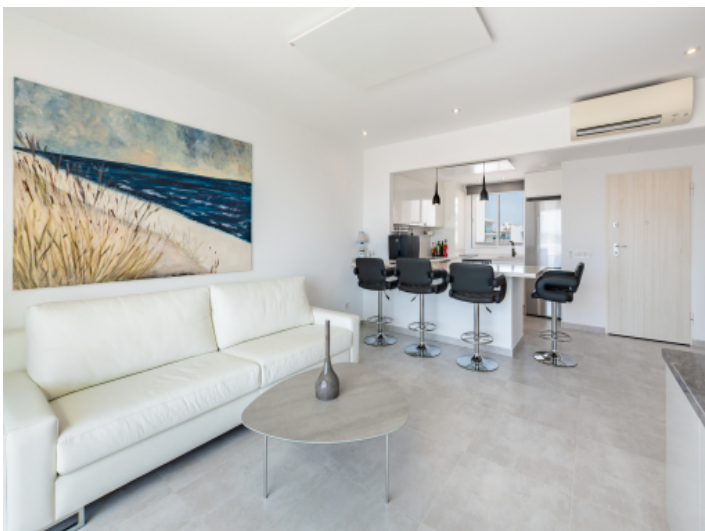
Wohn- und Essbereich