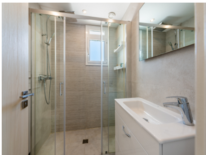
Das 2. Badezimmer