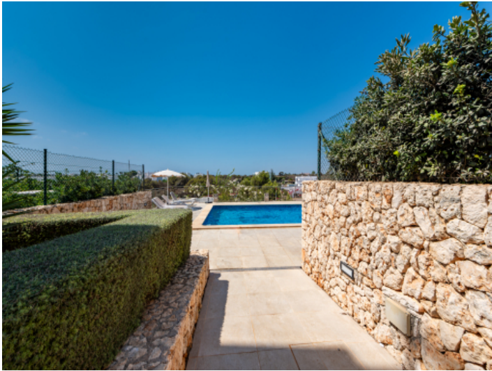
Zugang zum Gemeinschaftspool