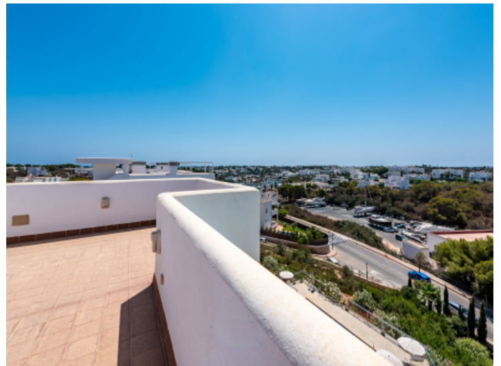
Weitblick auf den Hafen von Cala d'Or