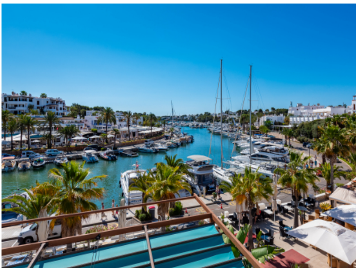
Hafen von Cala d'Or