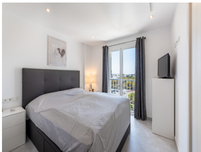
Eines von 2 Schlafzimmern