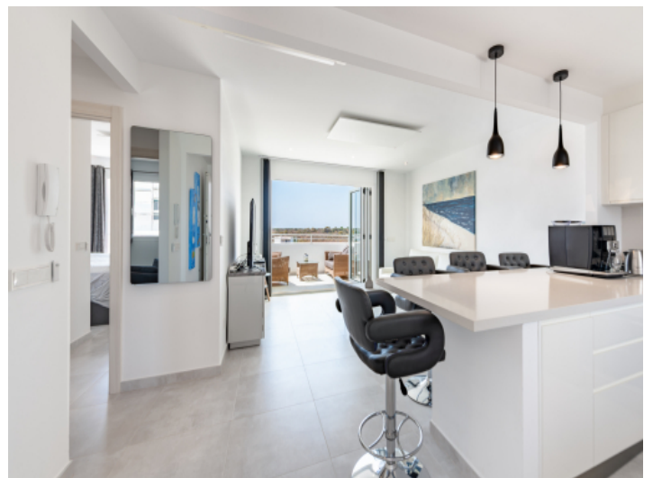
Blick von der Küche in den Wohnbereich