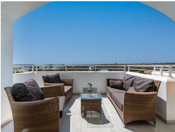
Terrasse am Wohnbereich