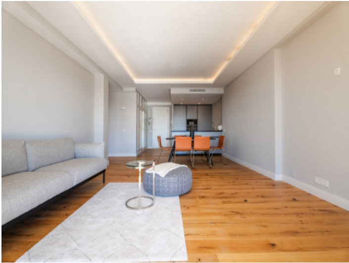
Sicht in den Wohnraum