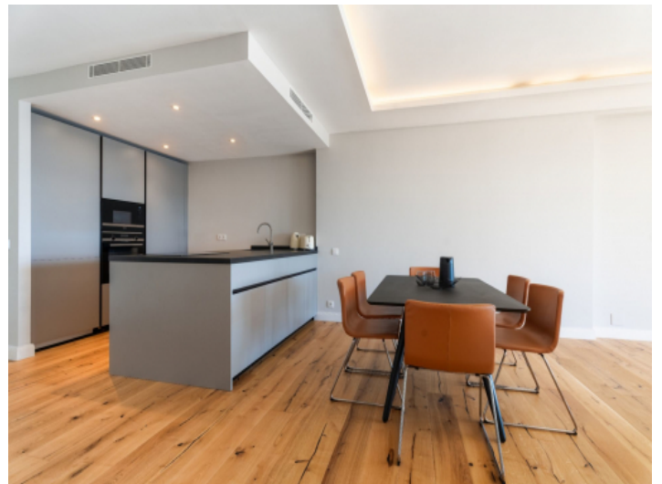
Essbereich und Küche