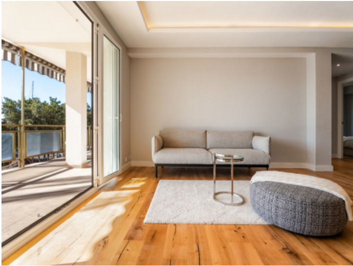
Wohnung in Toplage