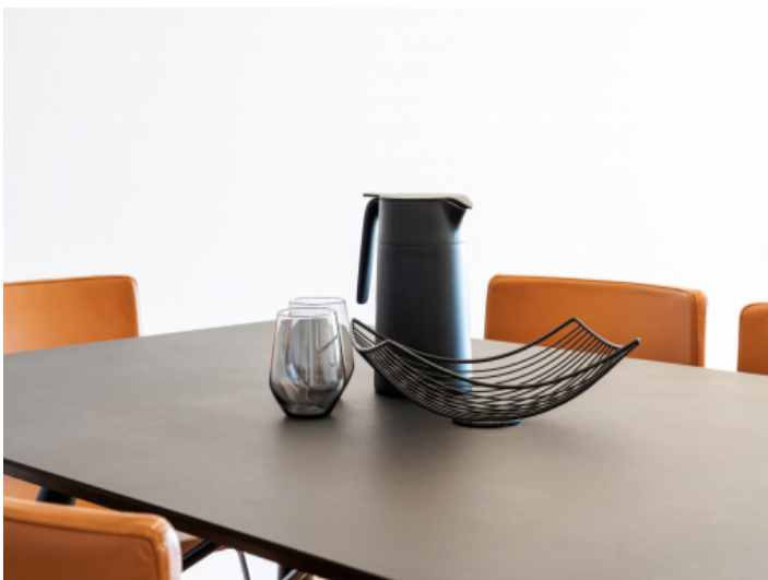
Hell und modern