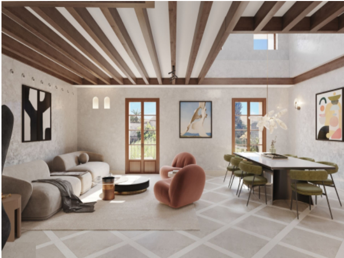
Nobler Wohn-und Essbereich