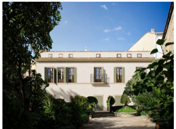
Ansicht auf das Gebäudes