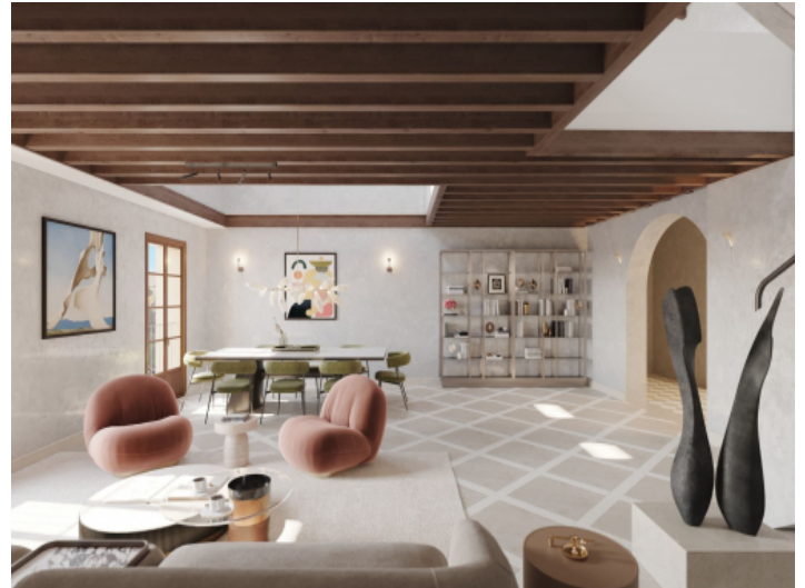
Offene und lichtdurchflutete Räume