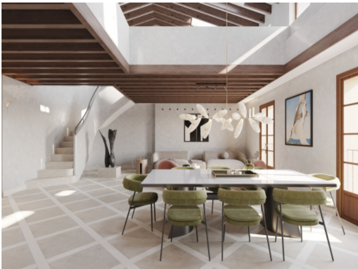
Verteilt über 2 Ebenen