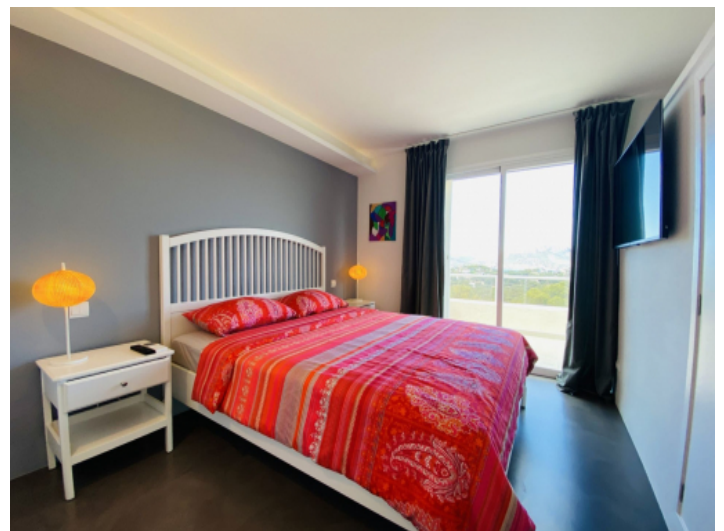
Ein weiteres Schlafzimmer