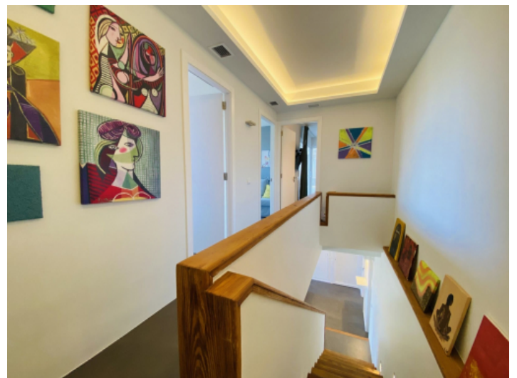
Flur 1. Etage