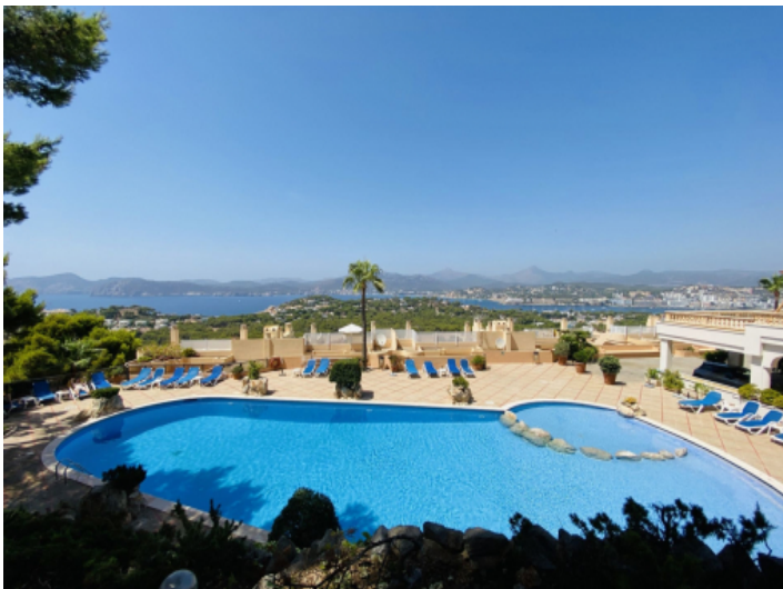
Apartment mit Panorama-Meerblick in Nova Santa