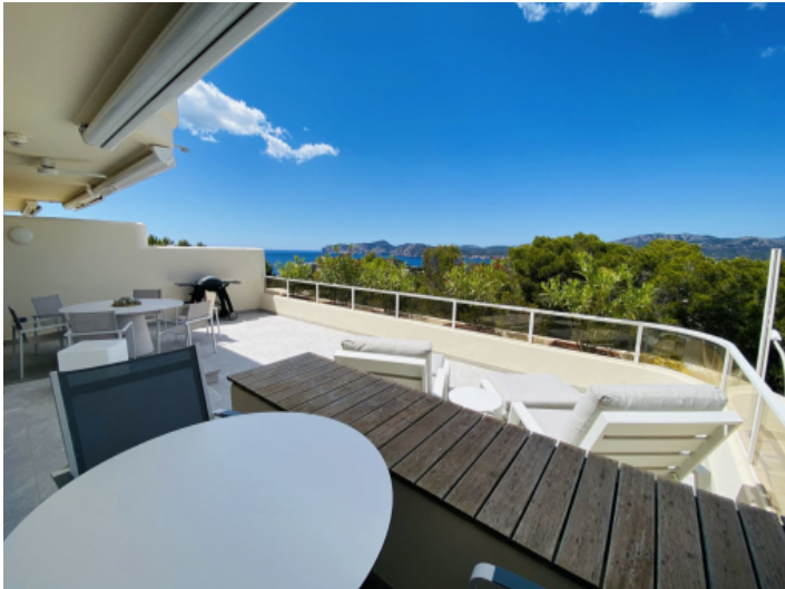
Wohnung, Santa Ponsa