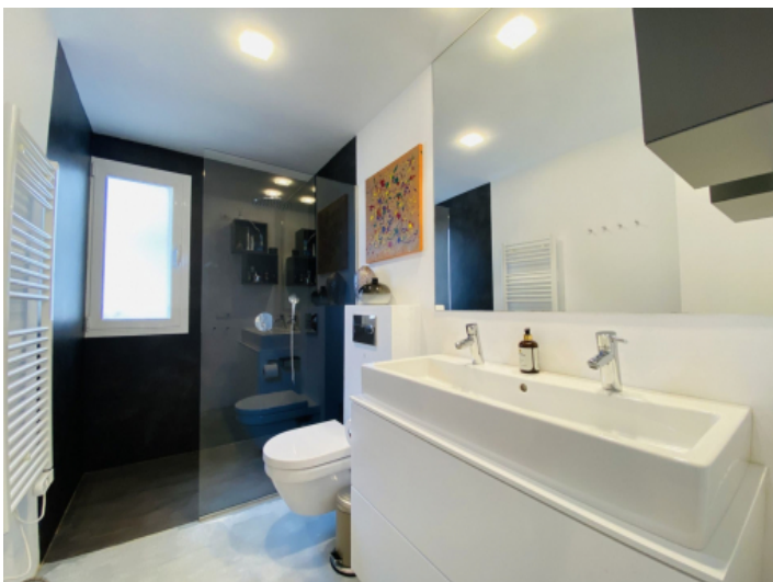
Badezimmern en Suite