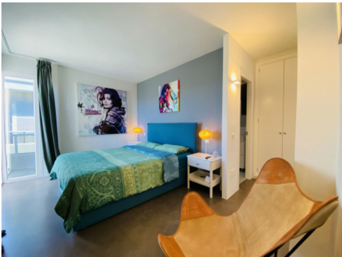
Hauptschlafzimmer mit Badezimmer en Suite