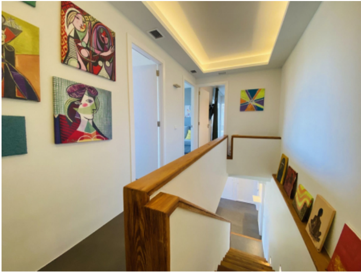
Flur 1. Etage