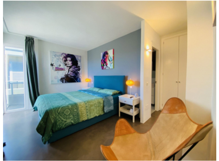
Hauptschlafzimmer mit Badezimmer en Suite