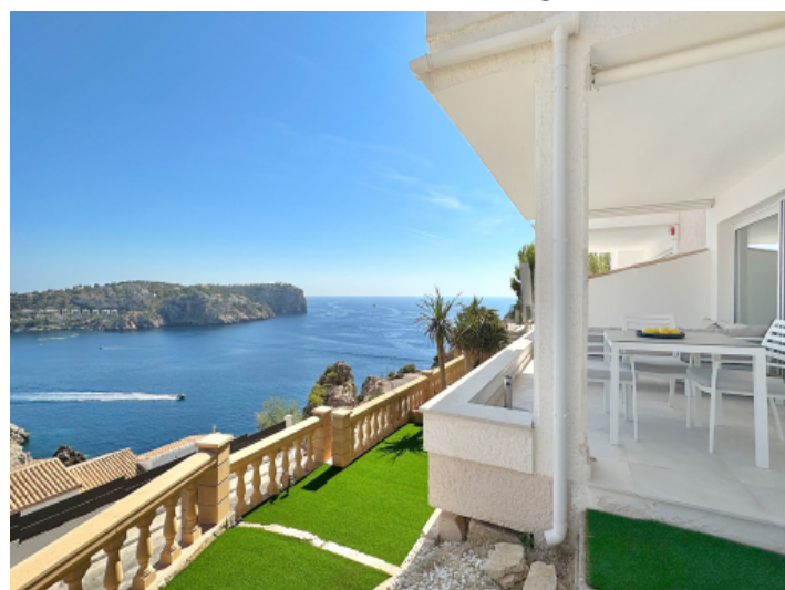
Blick auf den Balkon