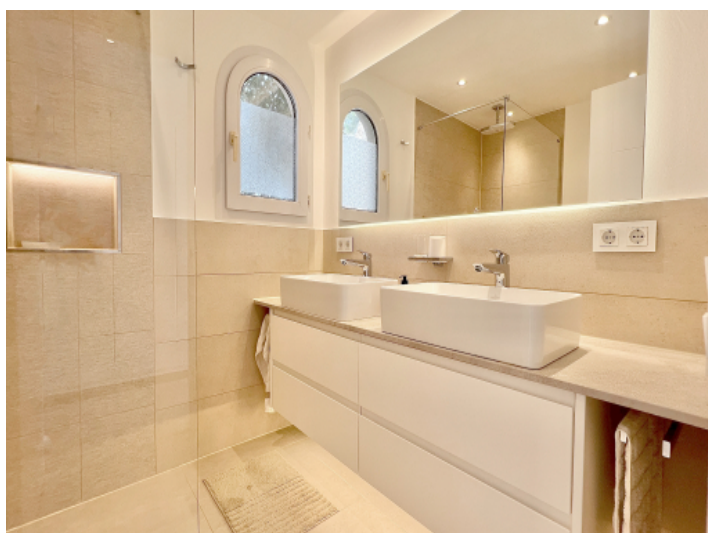
Badezimmer mit Dusche und Tageslicht