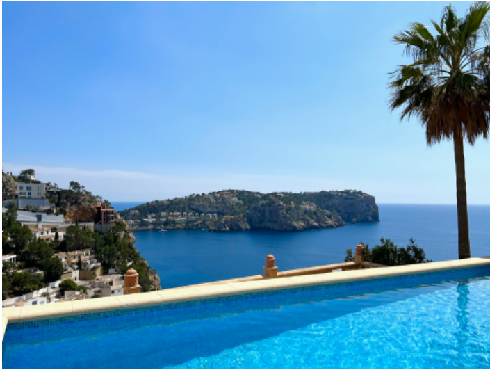
Gemeinschaftspool mit Blick auf das Mittelmeer