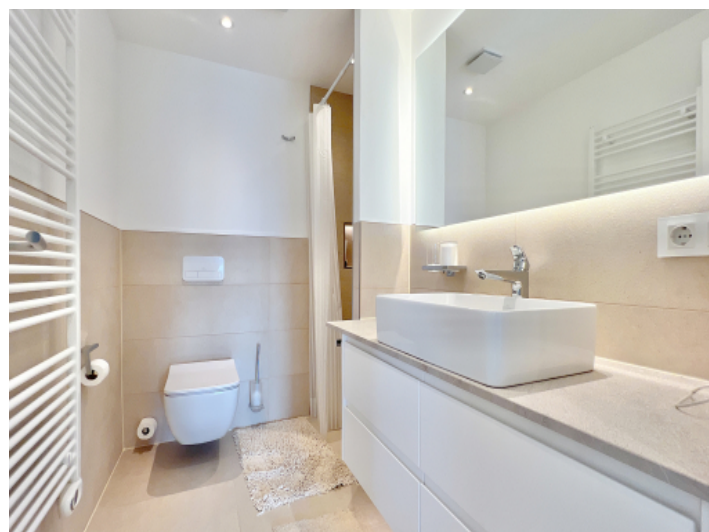
Badezimmer mit Heizung