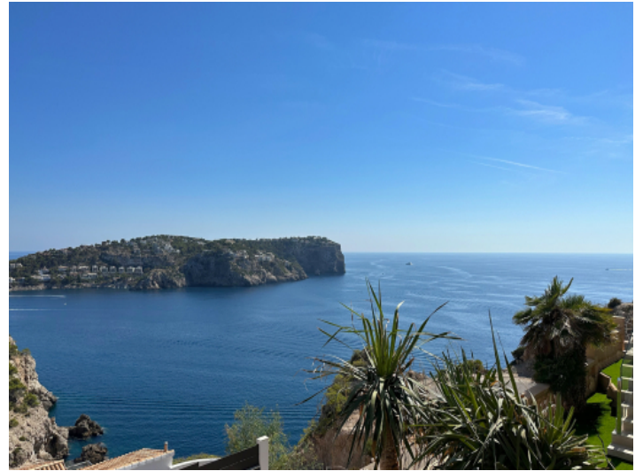
Einmaliger Blick auf das Mittelmeer