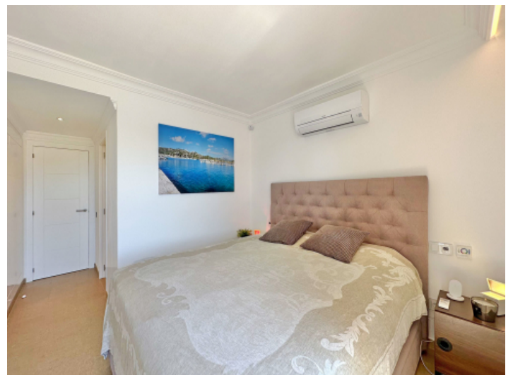
Schlafzimmer mit Klimaanlage