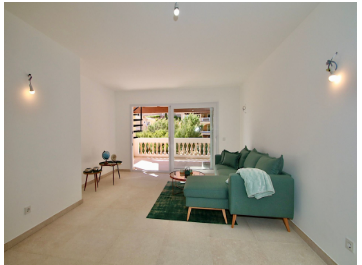
Der Wohnbereich grenzt direkt an die überdachte Terrasse