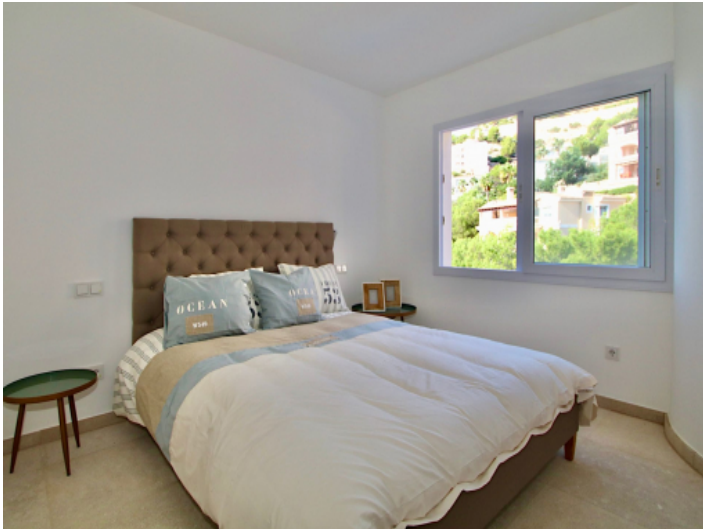
Bequemes Schlafzimmer mit Bad en Suite