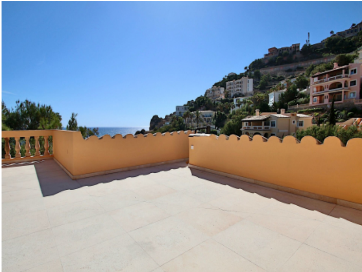
Große Dachterrasse mit Meerblick