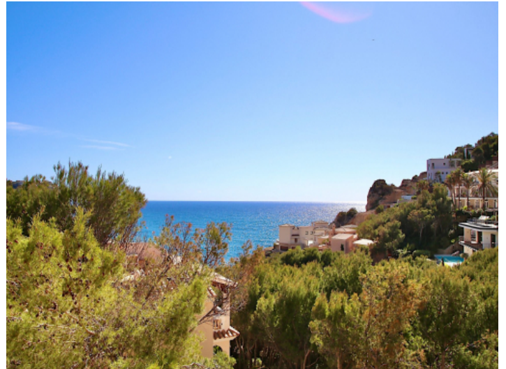
Meerblick und fantastische Sonnenuntergänge