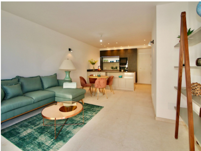
Offener Wohn- und Essbereich mit amerikanischer Küche