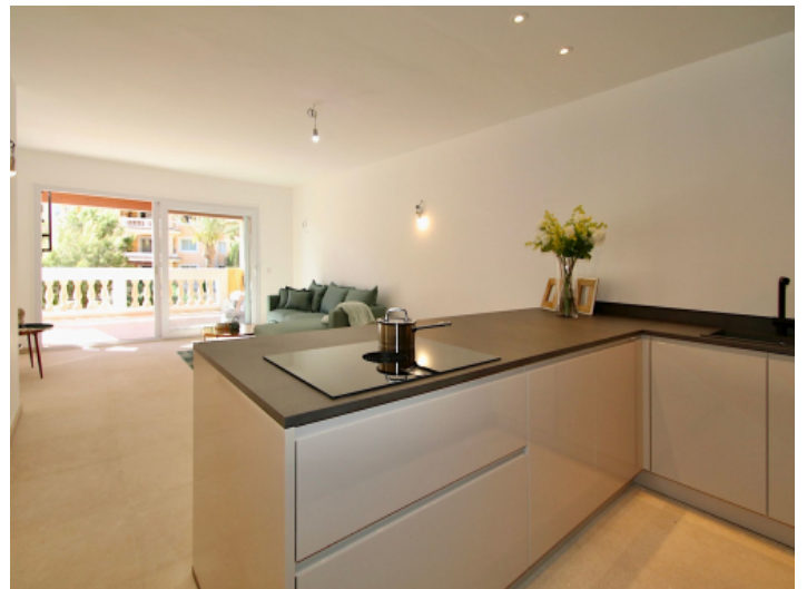
Kücheninsel mit Bora Kochfeld