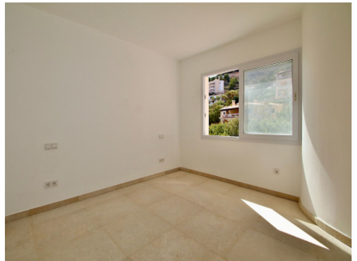
Die Wohnung ist kernsaniert und verfügt über