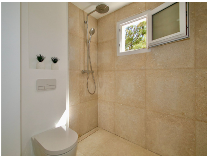
Hansgrohe und Duravit Sanitär