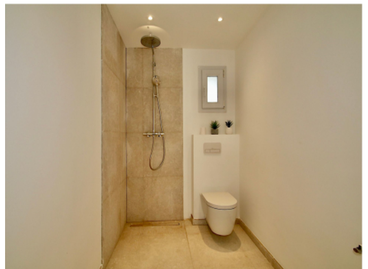
Das 2. Badezimmer