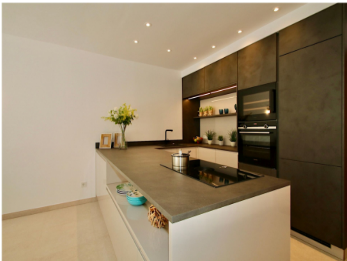
Moderne Küche in einem top renoviertem Apartment