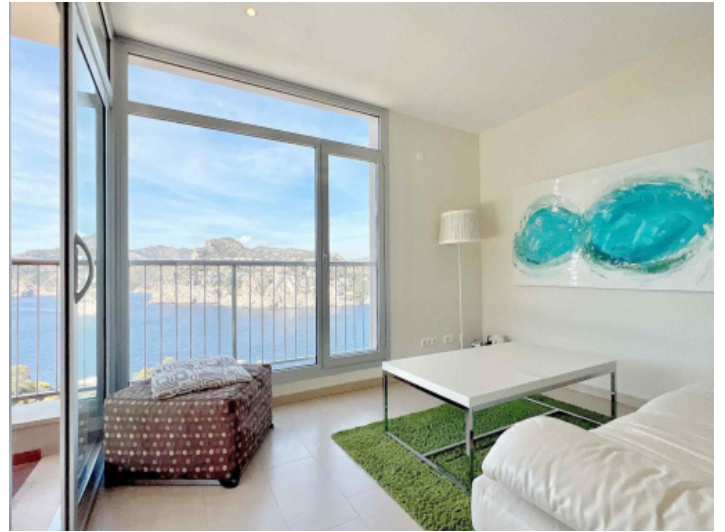
Wohnbereich mit tollem Meerblick