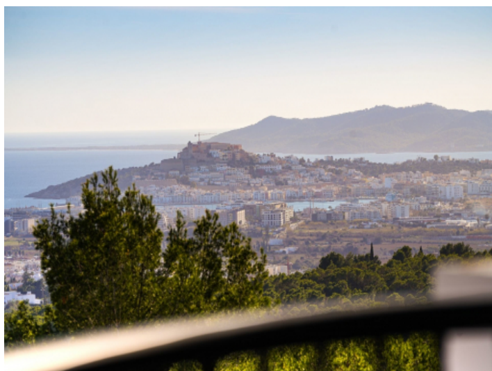
Traumaussicht auf Ibiza Stadt