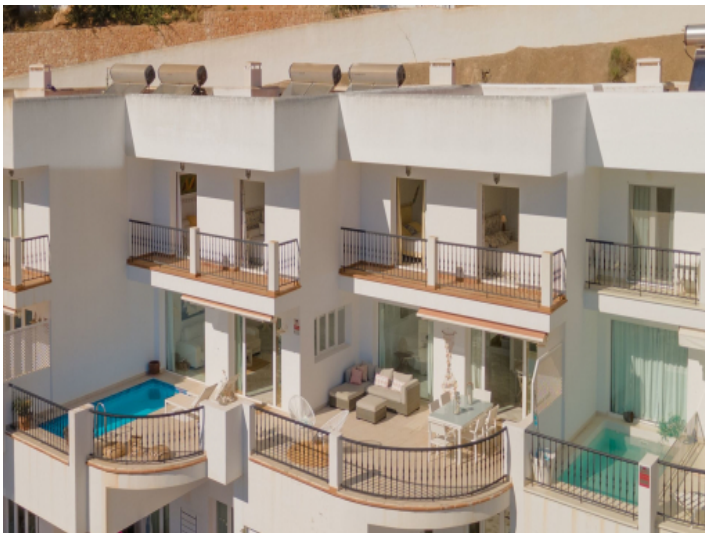
Sicht auf das wunderschöne Penthouse