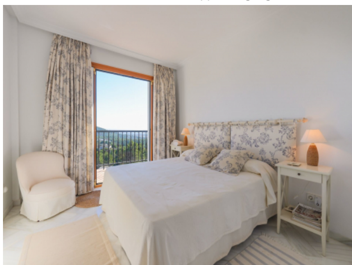
Eines von 6 Schlafzimmern