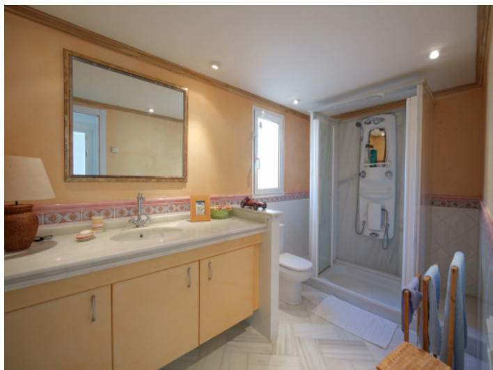
Eines von 6 Badezimmern