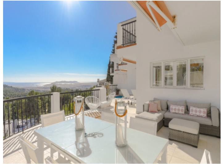
Große Terrasse mit Meerblick