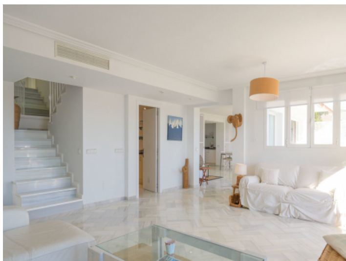
Wohnbereich mit Treppenaufgang