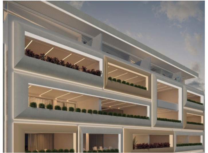
Außenansicht der Luxusapartments