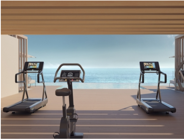
Fitnessraum mit herrlicher Aussicht