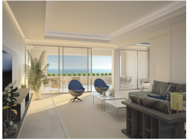
Modern designer Wohnbereich