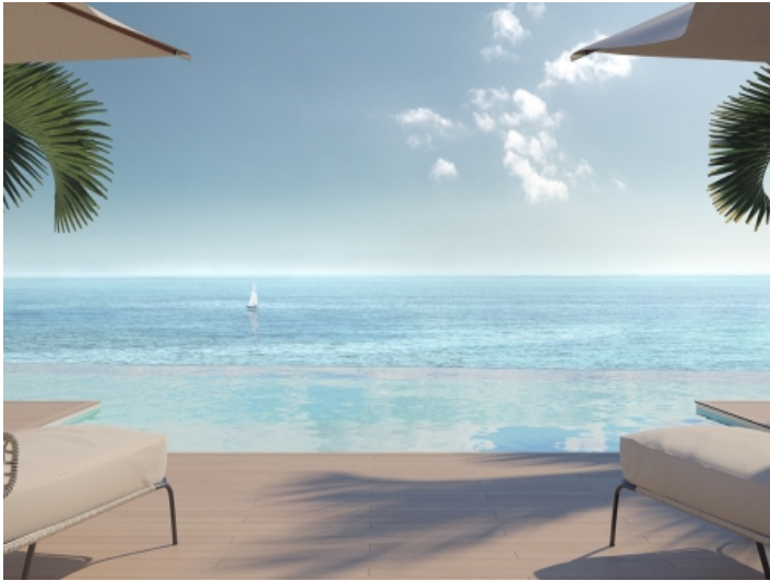
Pool mit traumhafter Aussicht