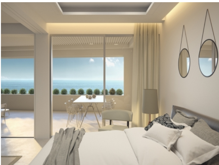
Schlafzimmer mit beeindruckender Aussicht