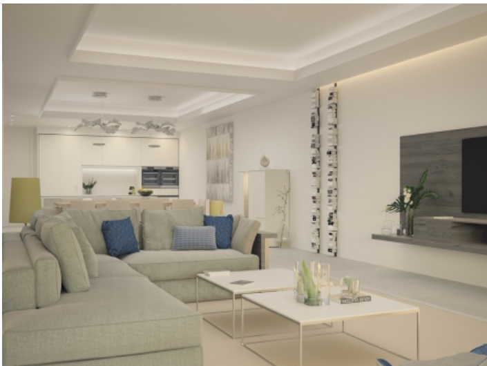
Großzügiger Wohn- und Essbereich