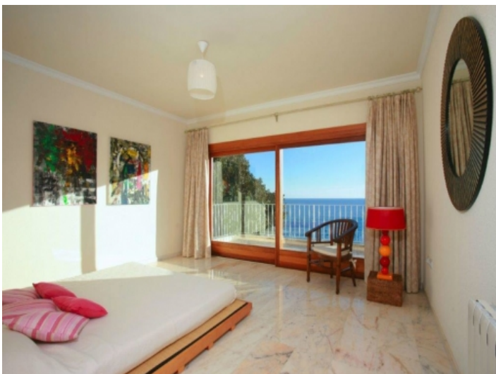
Hauptschlafzimmer mit direktem Terrassenzugang