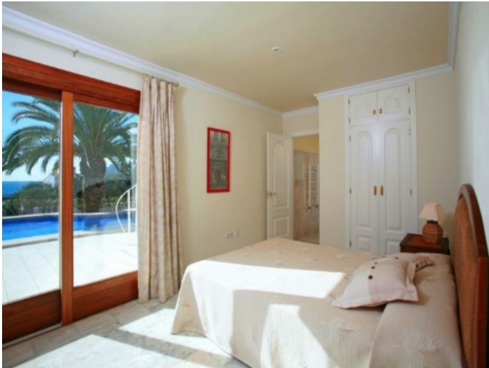
Weiteres Schlafzimmer mit Einbaukleiderschrank