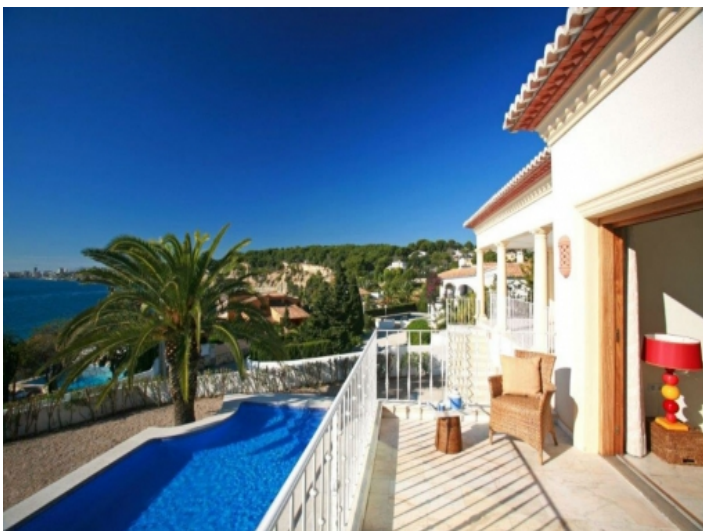
Wunderschöner Ausblick von der Terrasse