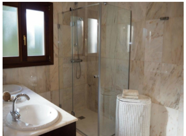
Badezimmer mit Dusche und Tageslicht