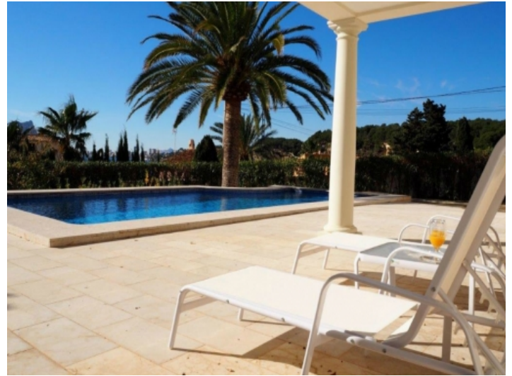
Großzügig geschnittener Poolbereich