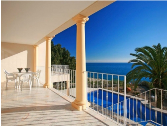
Atemberaubender Meerblick von der Terrasse