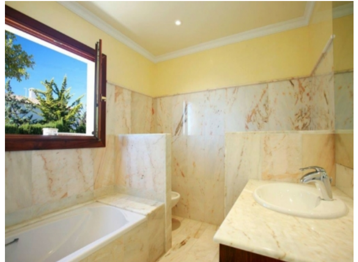
Hauptschlafzimmer mit Badewanne und Tageslicht