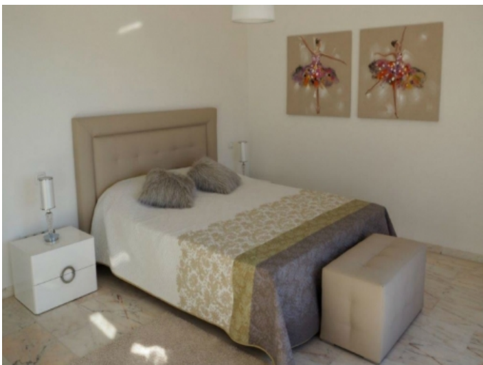
Drittes Schlafzimmer mit Doppelbett