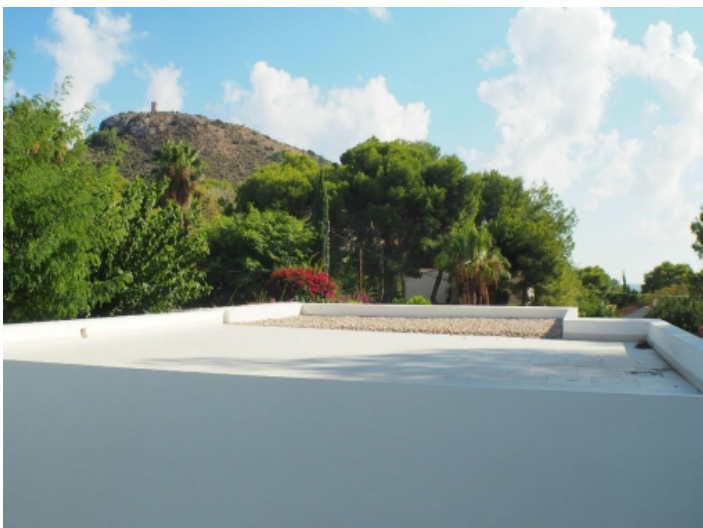
Großzügig geschnittene Dachterrasse