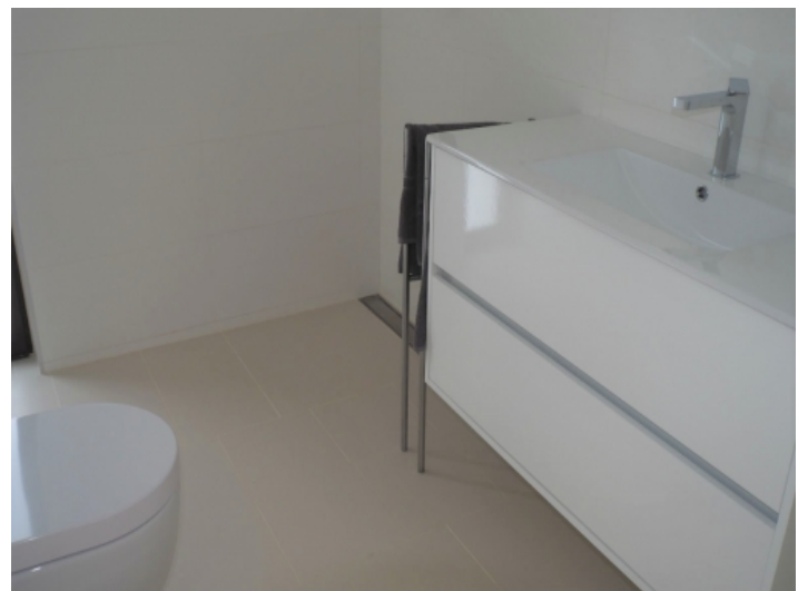
Badezimmer mit Tageslicht