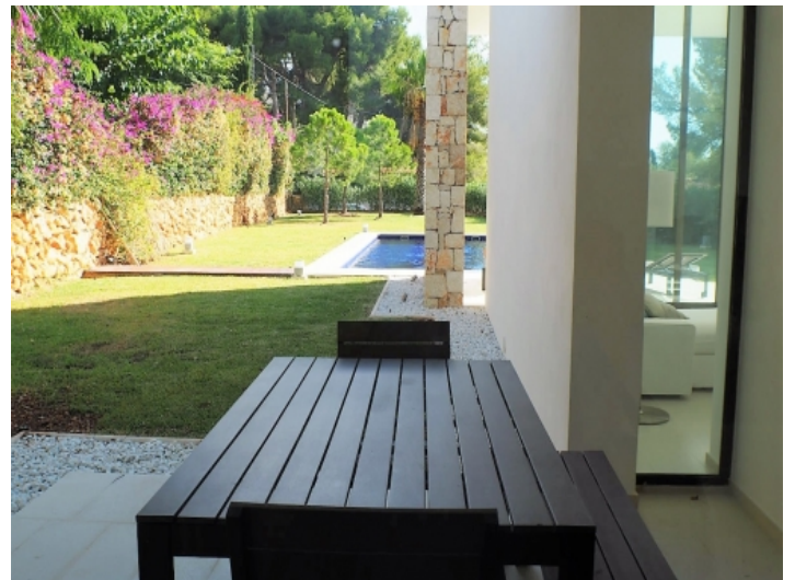
Überdachte Terrasse mit Blick auf den Pool