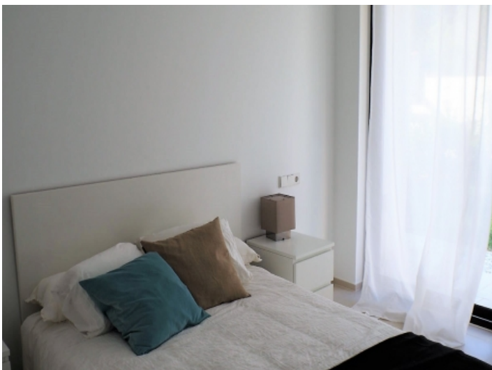
Gemütliches Schlafzimmer mit Doppelbett