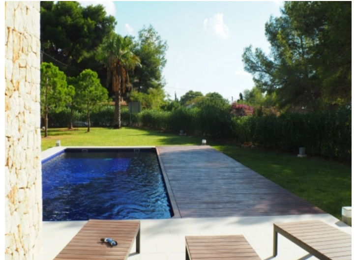
Sonnenterrasse mit hochwertigen Loungemöbeln