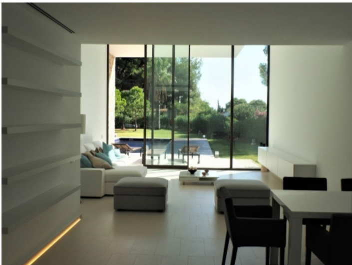
Wohnbereich mit Blick auf den Garten