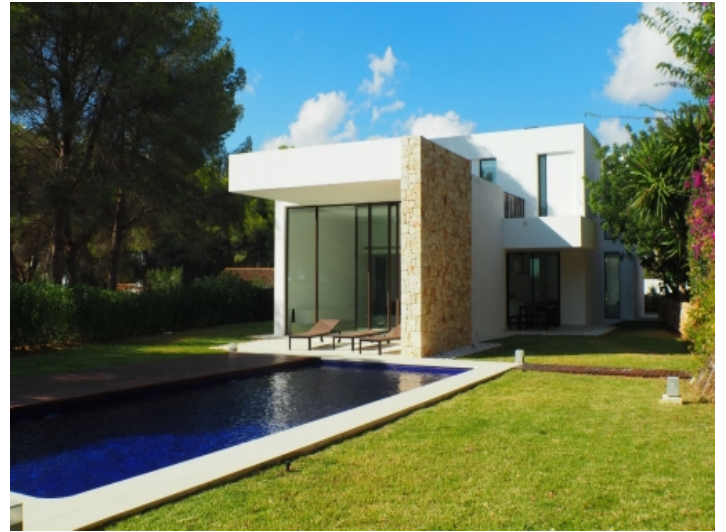
Gepflegter Garten mit großem Pool