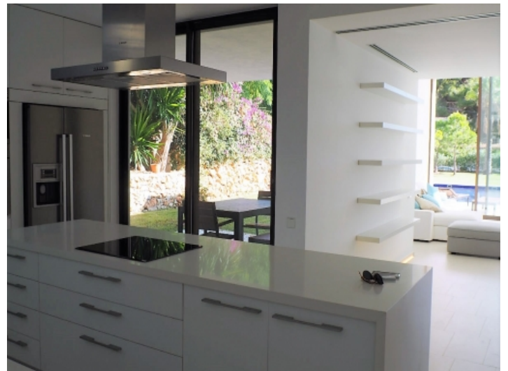
Moderne und voll ausgestattete Küche