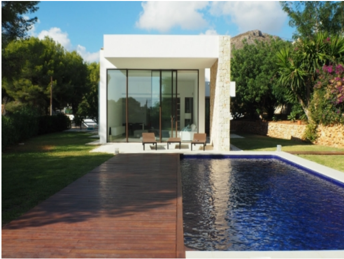
Vorderansicht der modernen Villa