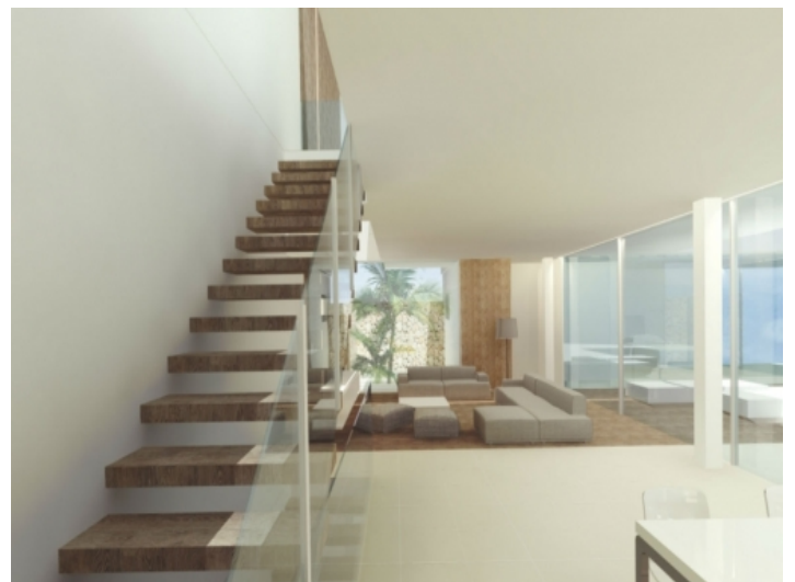
Moderner Treppenaufgang in die obere Etage