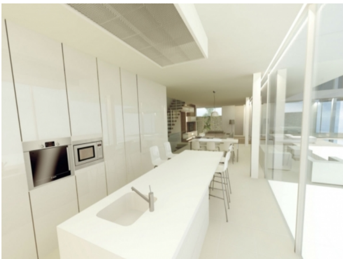
Lichtdurchflutete und voll ausgestattete Küche