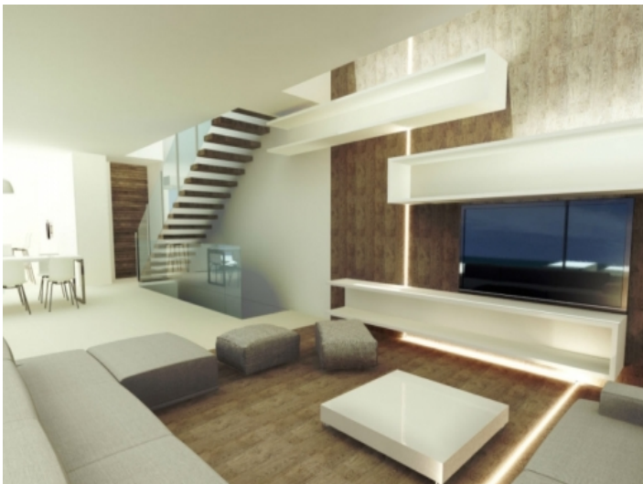
Offener Wohnbereich mit Treppen in die zweite Etage