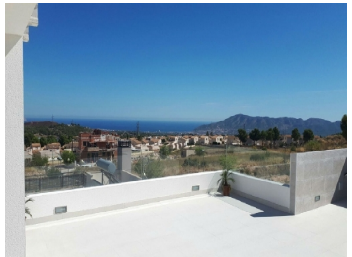
Dachterrasse mit Blick auf das Meer