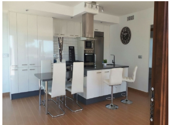
Modernes und helles Wohnzimmer