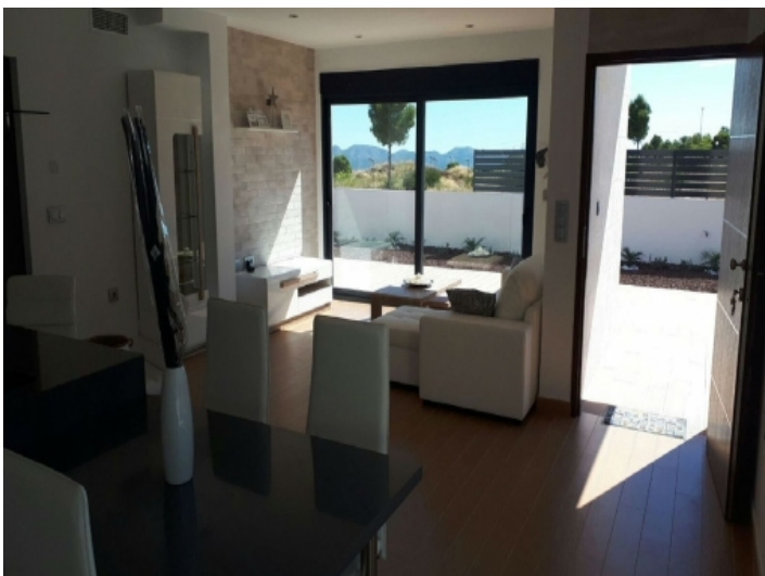
Gemütliche Sitzecke im Wohnzimmer