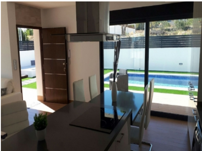
Wohnzimmer mit Zugang zum Poolbereich