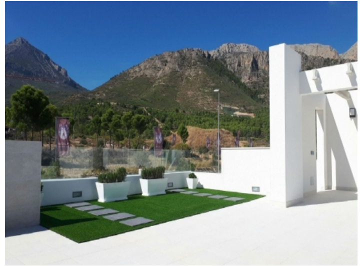
Garten mit Blick auf die umliegenden Berge