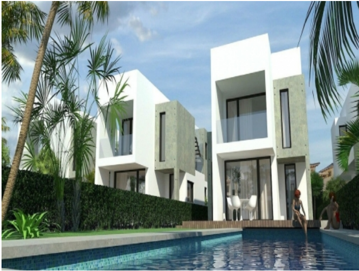
Designstudie des Poolbereiches