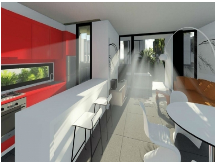
Designstudie der Küche