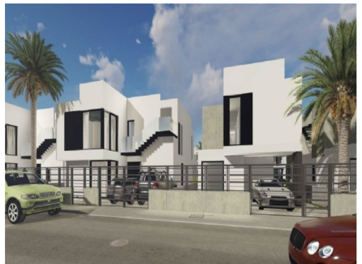
Designstudie der Wohngegend