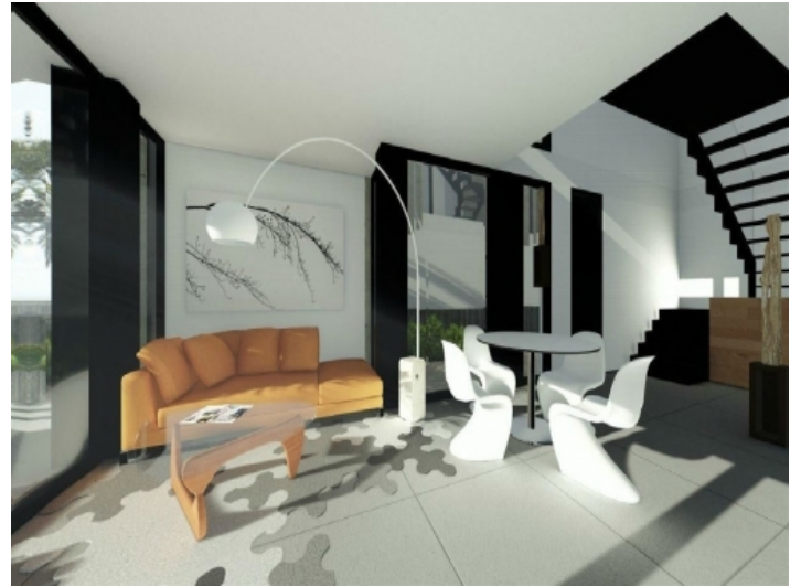
Designstudie des Wohnzimmers