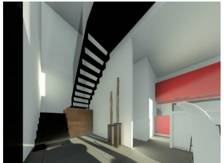
Treppe zum 1. Stock