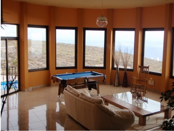
The salon with pool table and access to the terrace