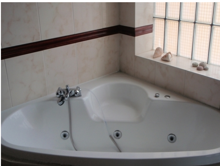
One of the bathrooms with bathtub