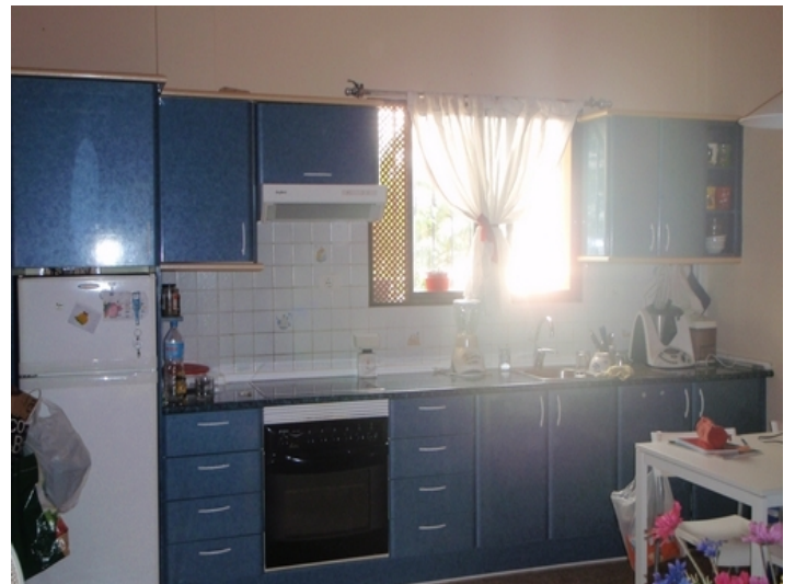
Kitchen in one of the guest apartments