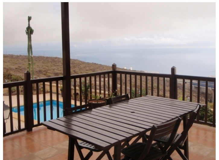
One of the large terraces overlooking the sea and the pool