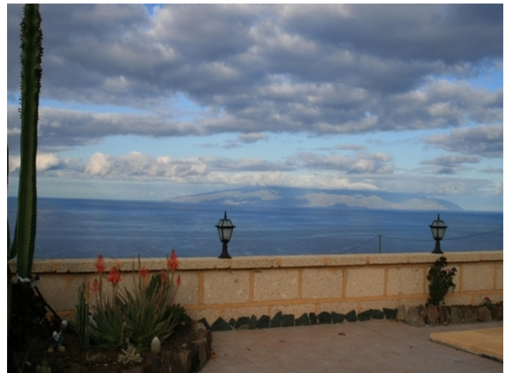
Wonderful views of the sea and the neighbouring islands