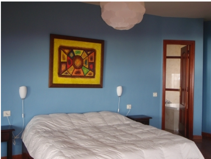
One of the bedrooms with bathroom en suite