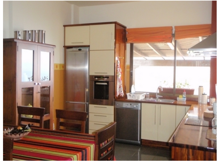
The modern kitchen with high quality built-in appliances