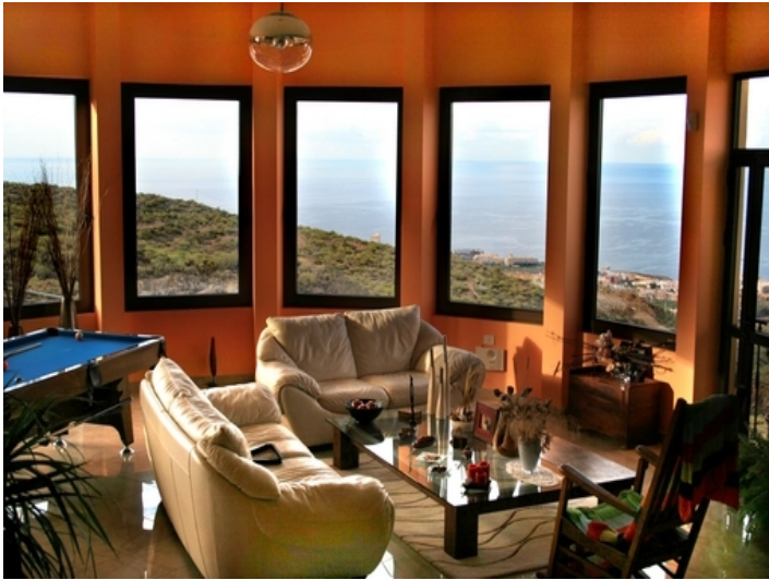
The living room with round panoramic windows and