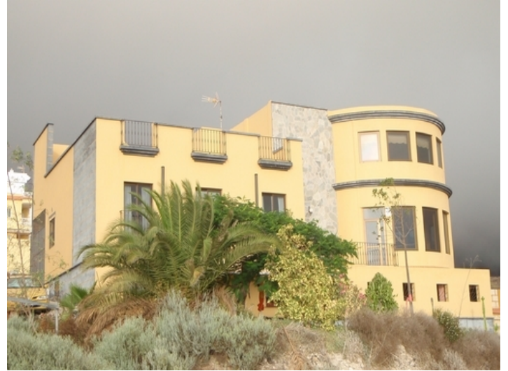
Exterior view of the stately villa