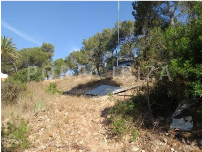
PLOT ORIG PIC 4