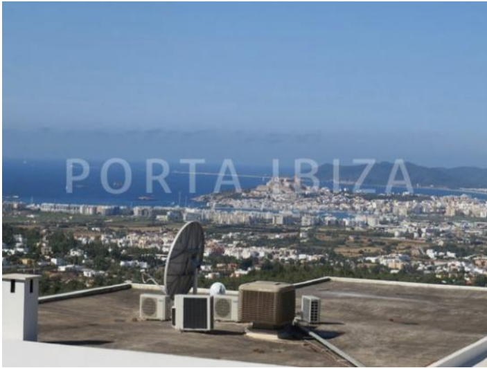
PLOT ORIG PIC 7