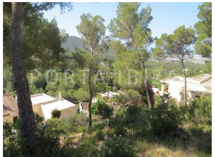
PLOT ORIG PIC 6

area-plot-project-Can-Furnet-amazing-view-to-sea-and-Ibiza