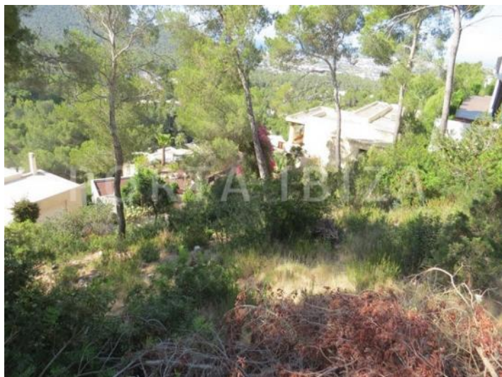
PLOT ORIG PIC 8