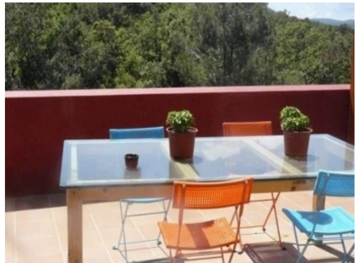
Sonnterrasse mit Bestuhlung