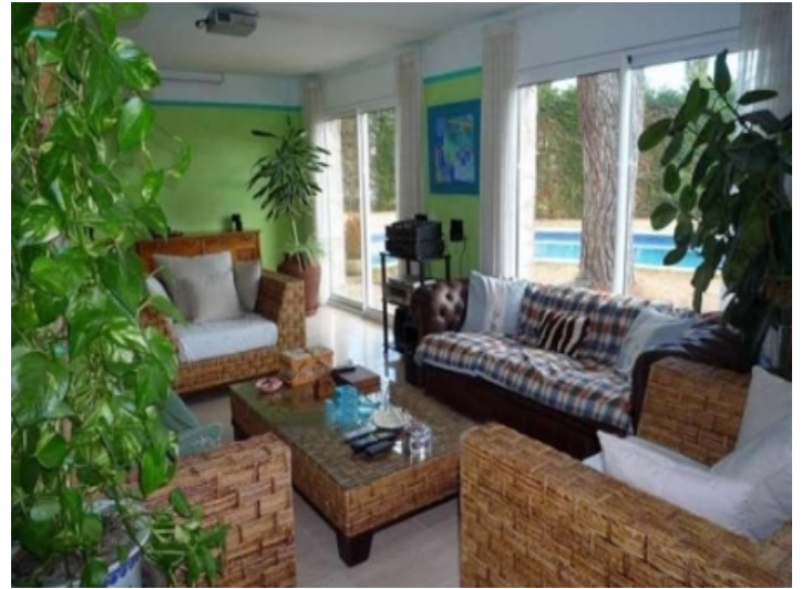
Eines der 2 exotischen Wohnzimmer