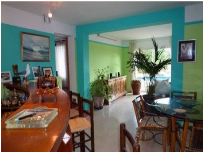
Eines der 2 Esszimmer mit Bar