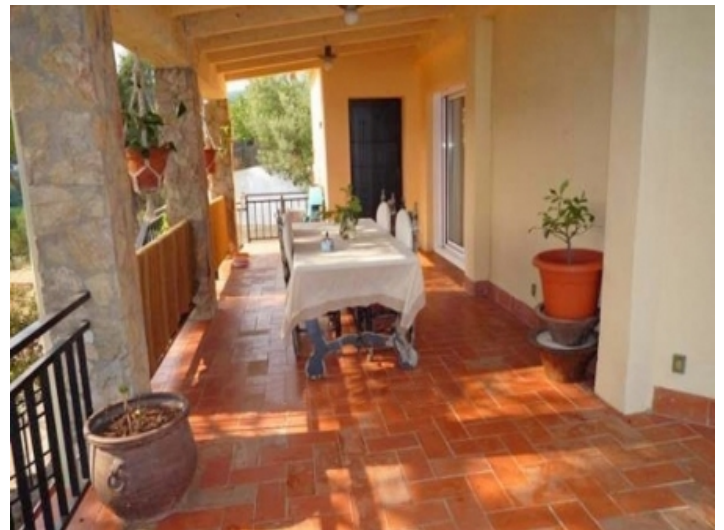
Überdachte Terrasse in der ersten Etage