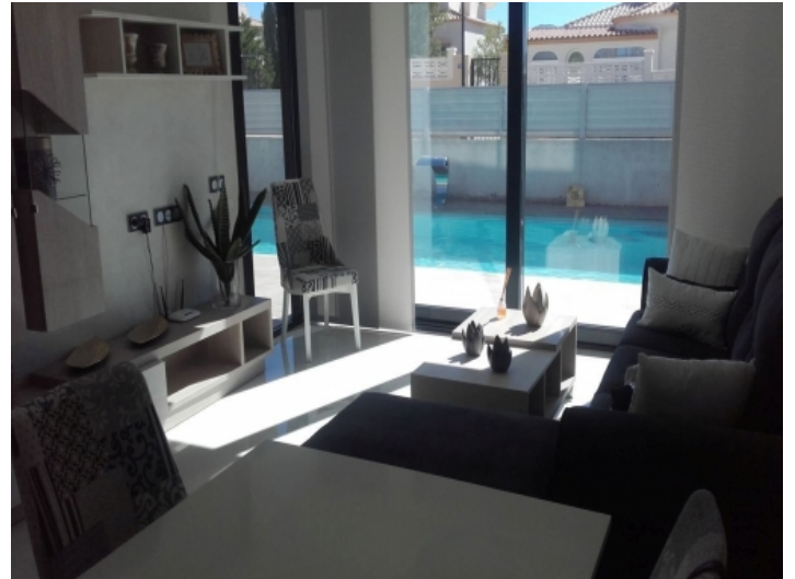
Wohnbereich mit Terrassenzugang