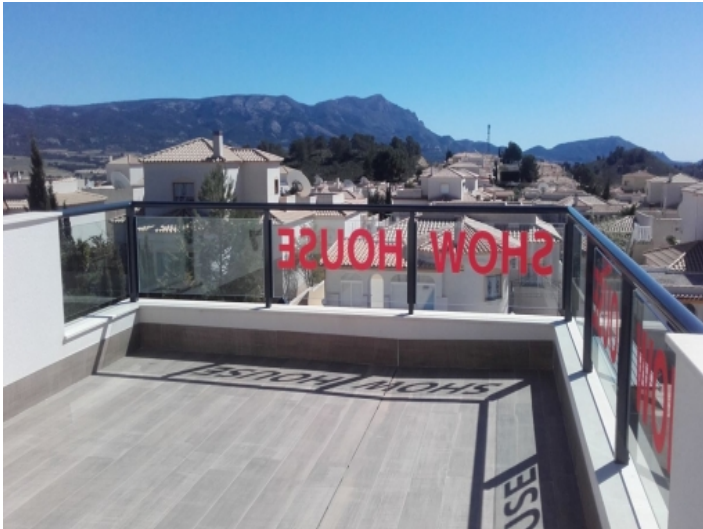
Terrasse im Obergeschoss