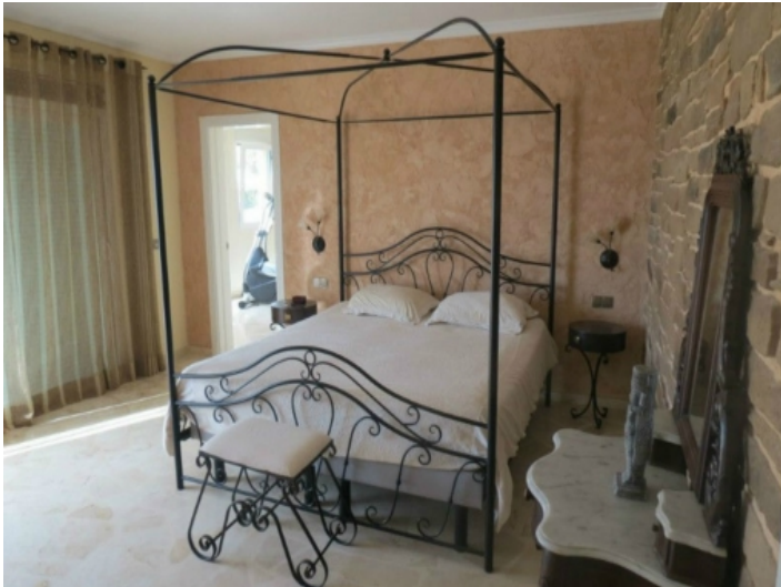
Schlafzimmer mit Steinwand