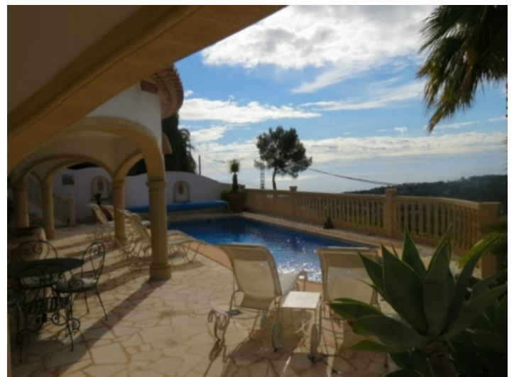
Großartige Aussicht vom Poolbereich