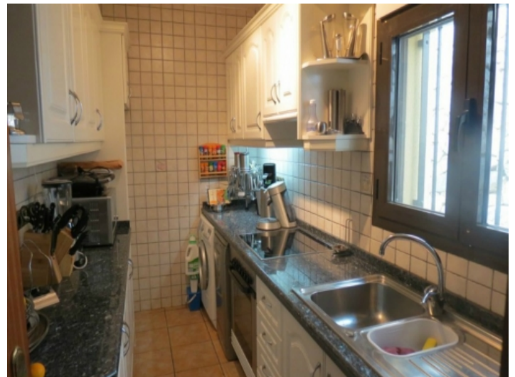
Weitere voll ausgestattete Küche