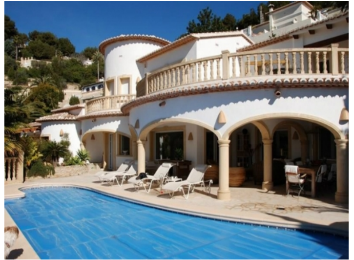
Representative Villa mit Pool