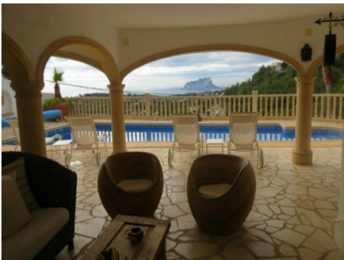
Pool mit atemberaubendem Meerblick