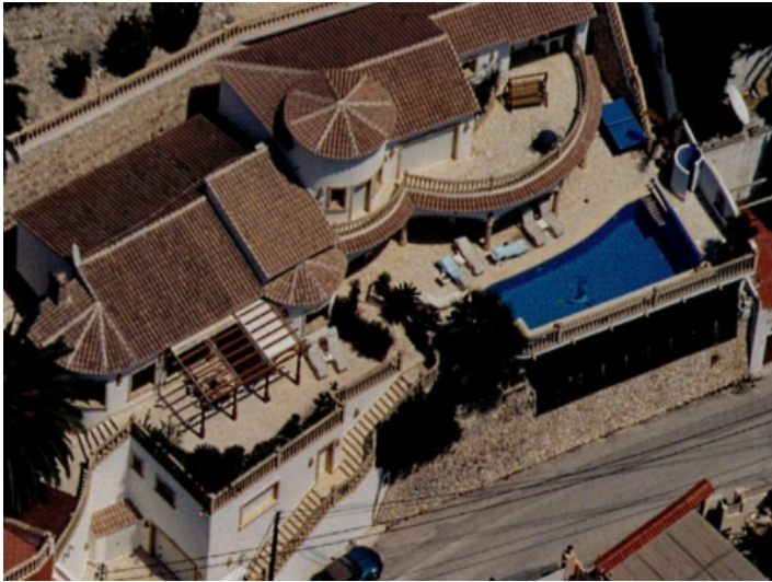
Vogelperspektive der Villa