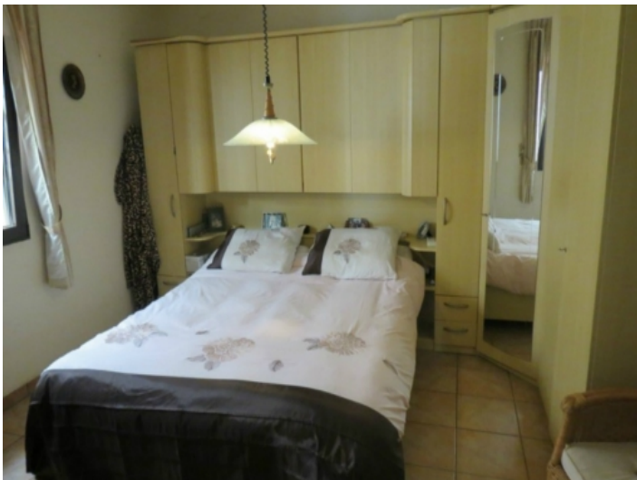
Schlafzimmer mit großem Schrank