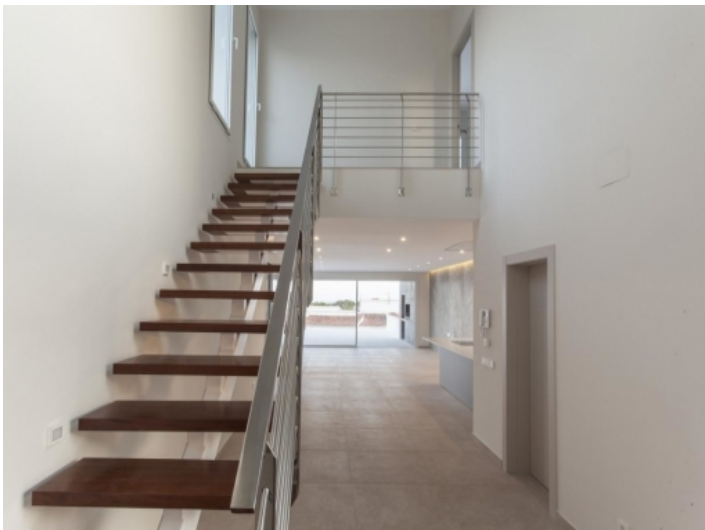
Treppe, die zum 1. Stock führt