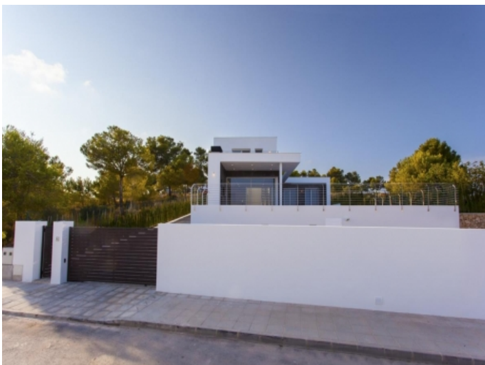
Vorderansicht der Villa