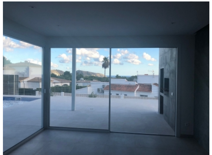
Meerblick vom Wohnzimmer