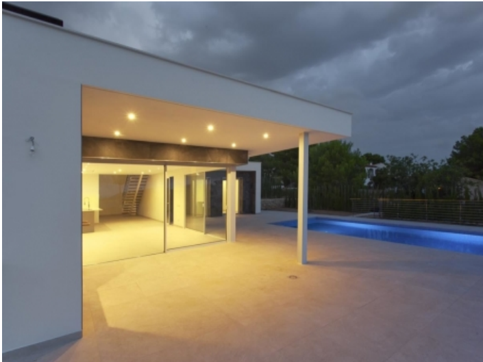
Außenbereich mit Pool