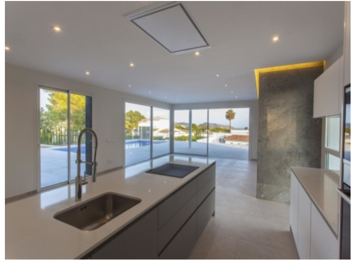
Wohnzimmer mit Zugang zum Pool