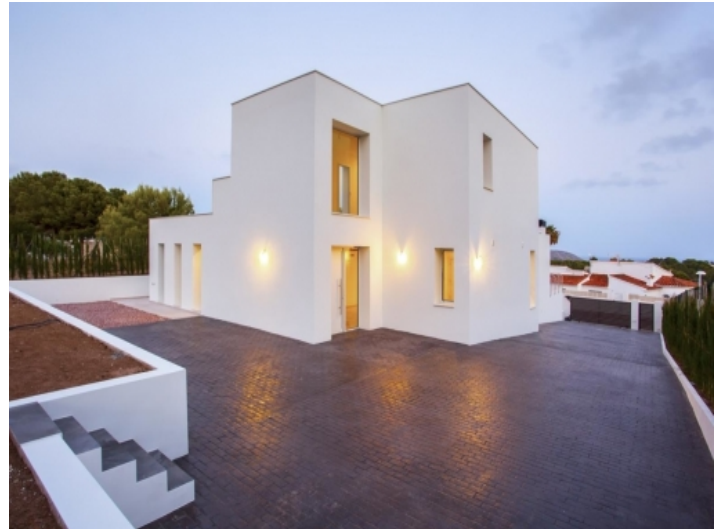
Rückansicht der Villa