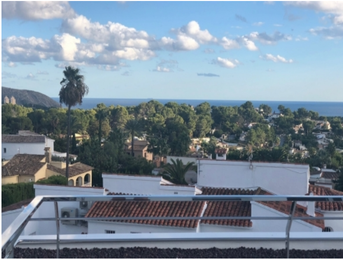
Atemberaubender Meerblick von der Terrasse