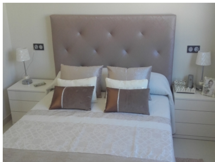
Eines der Schlafzimmer