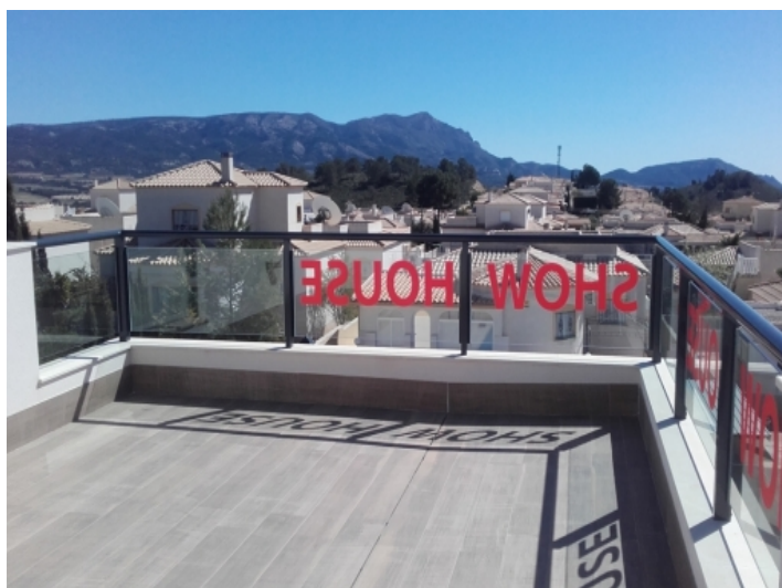
Terrasse mit Panoramabergblick