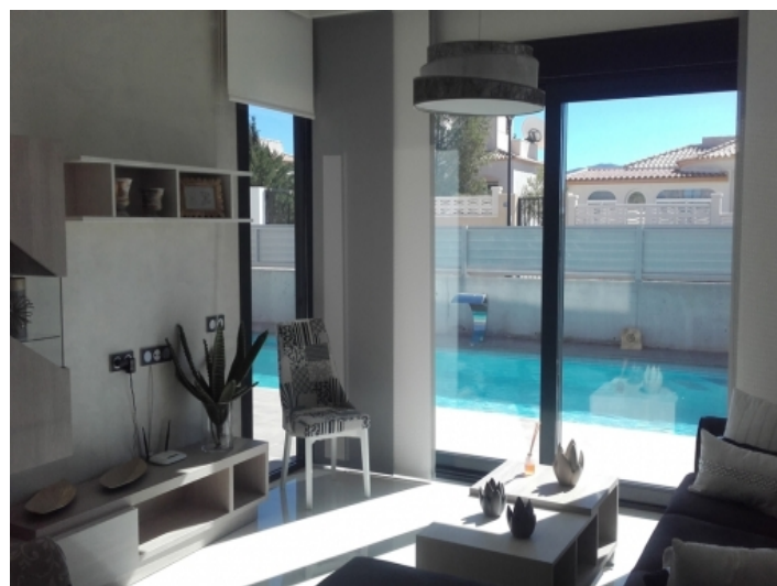
Wohnzimmer mit direktem Zugang zum Pool