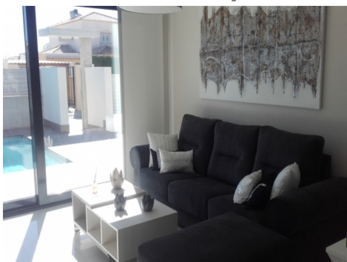
Direkter Poolzugang aus dem Wohnzimmer