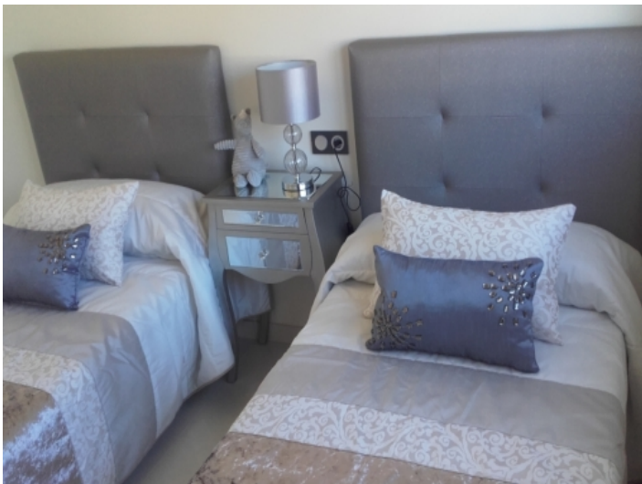
Schlafzimmer mit 2 Einzelbetten