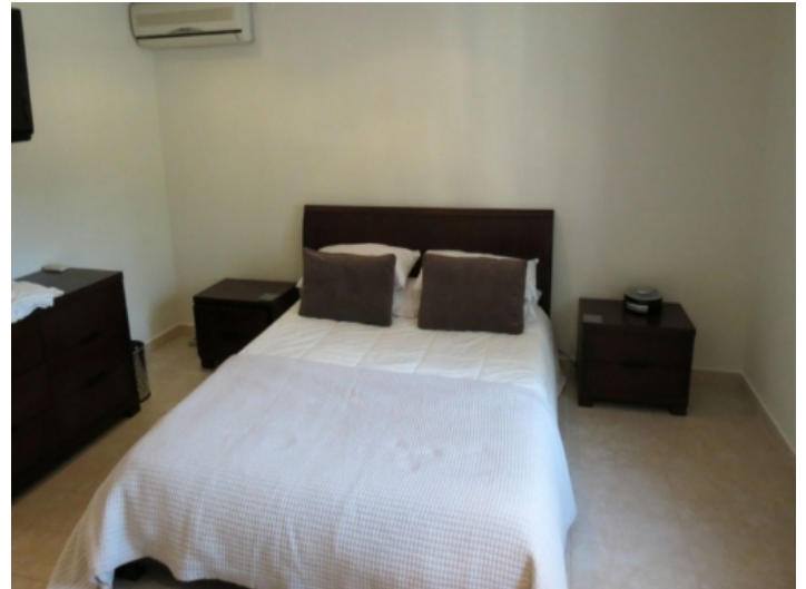
Weiteres Schlafzimmer mit großen Fenstern