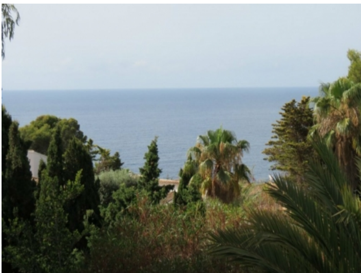
Meerblick von der Villa