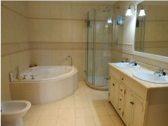
Großes Badezimmer mit Dusche und Badewanne