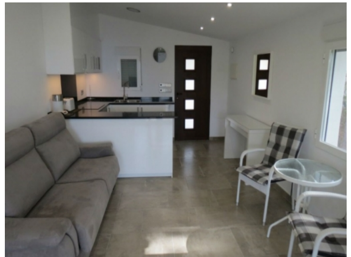
Gästepartment mit Küche und Wohn-/Essbereich