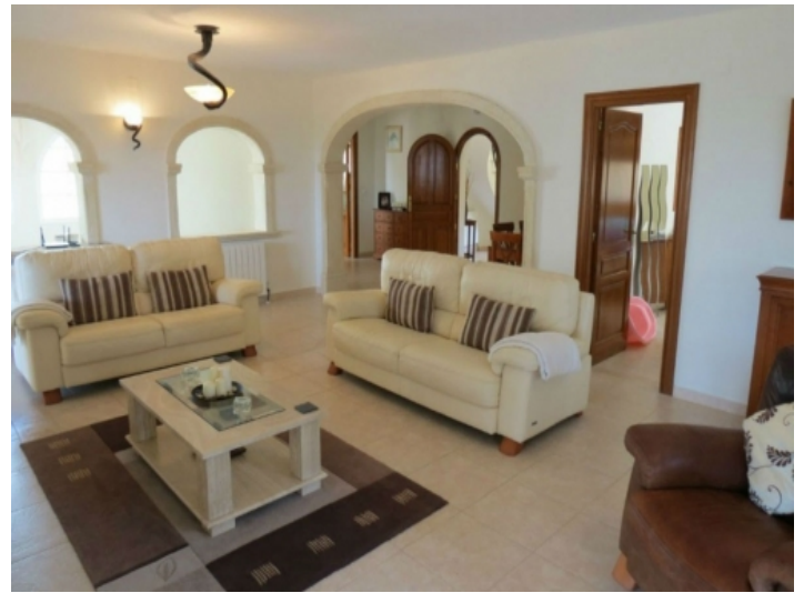
Gemütliches Wohnzimmer der Villa