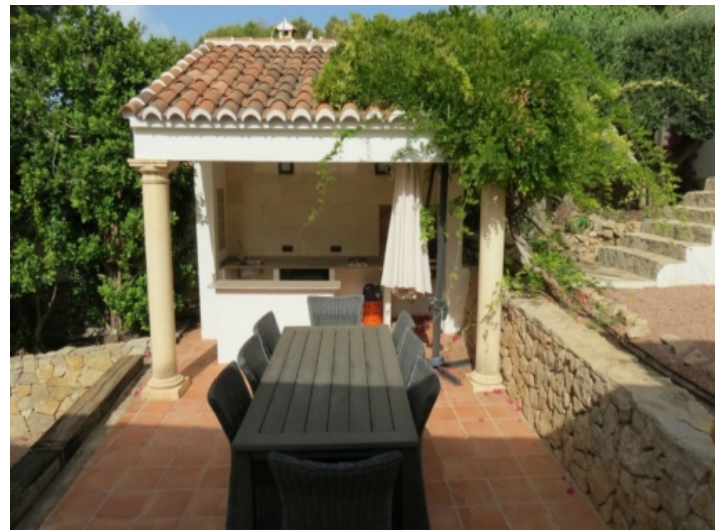
Gartenbereich der Villa mit Küche im Freien