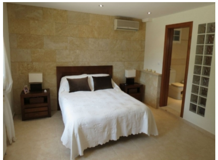
Hauptschlafzimmer der Villa mit Badezimmer en suite