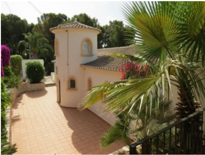
Hofeinfahrt der Villa