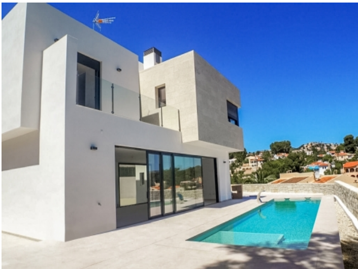
Terrasse mit Pool und traumhaftem Ausblick