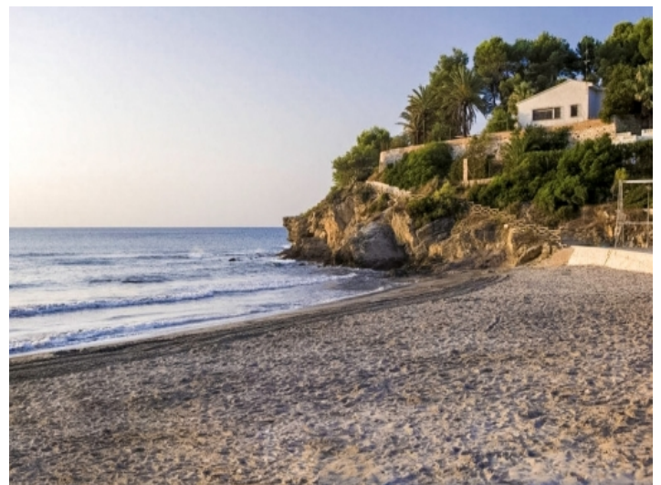
Nahegelegener Strand La Fustera