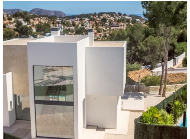
Exklusiver Blick auf Benissa und Umgebung