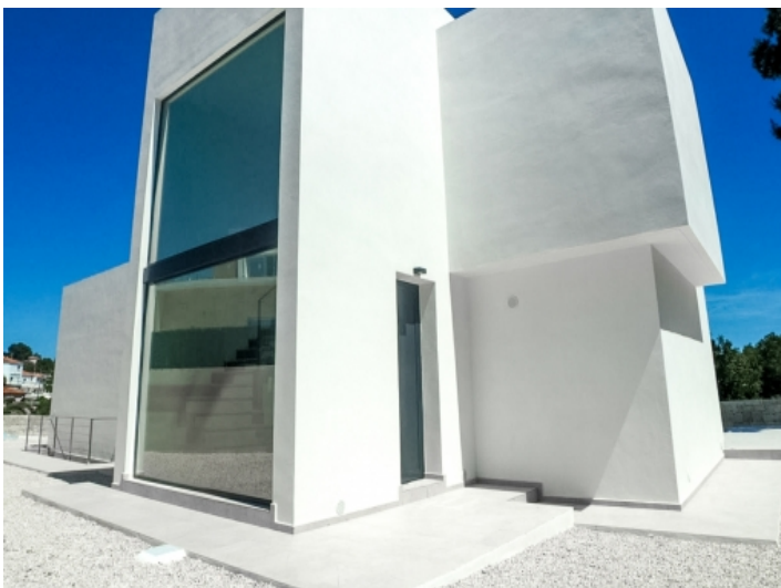
Verglaste Hinteransicht der Villa