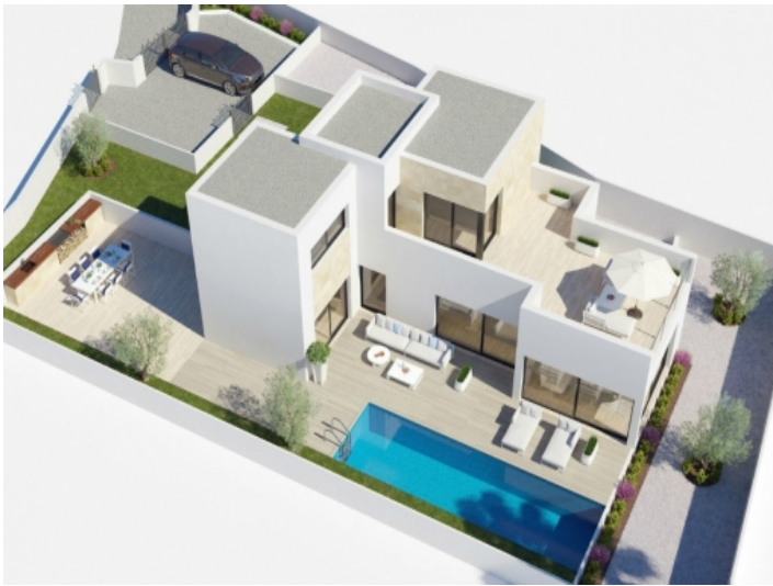
Gesamtansicht des modernen Neubauprojektes