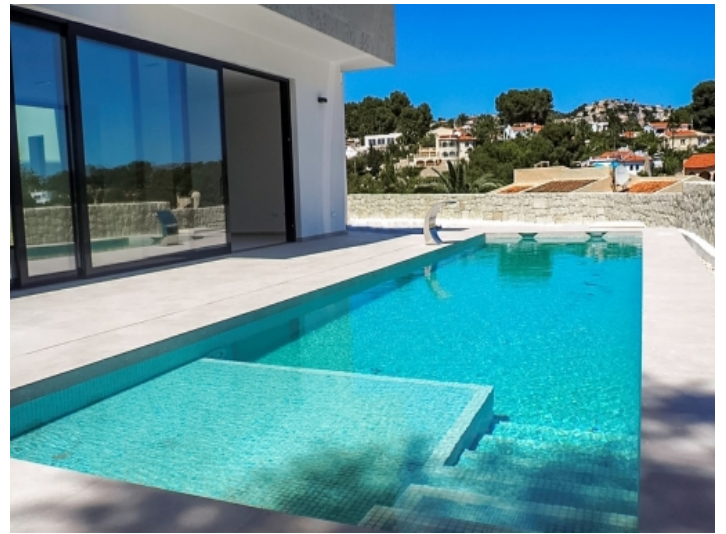
Großer, puristischer Poolbereich