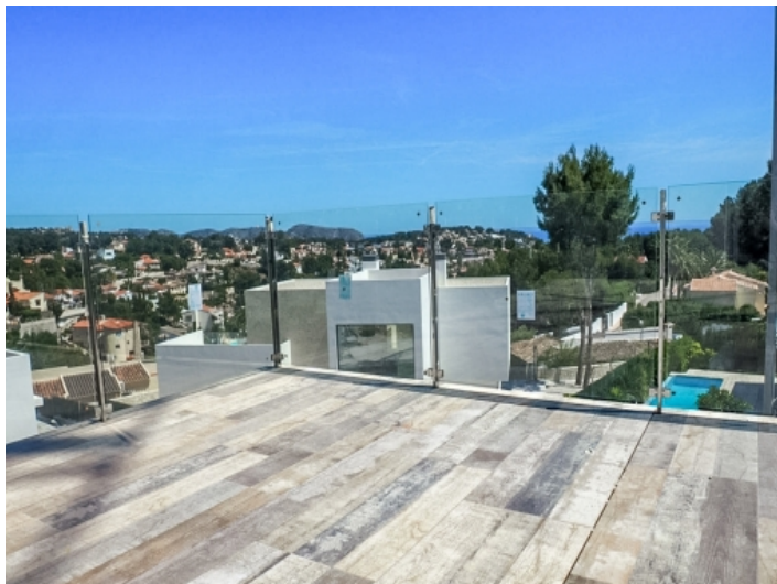
Stilvolle Dachterrasse mit atemberaubendem Ausblick