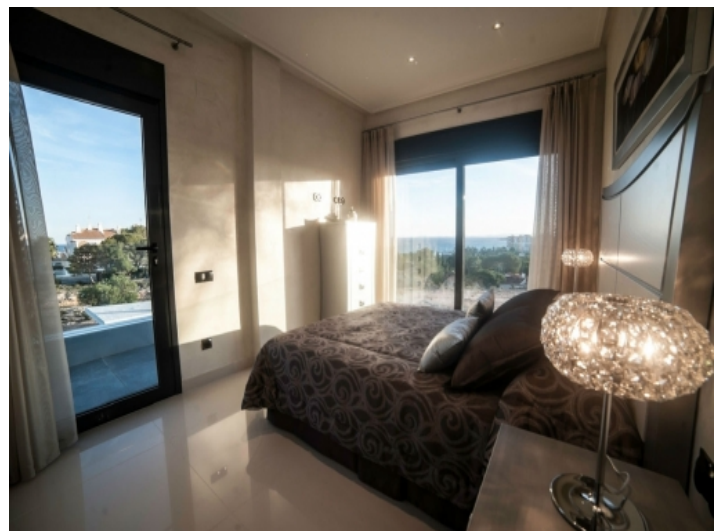
Schlafzimmer mit Ausblick