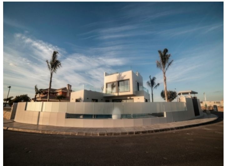
Blick auf das Grundstück