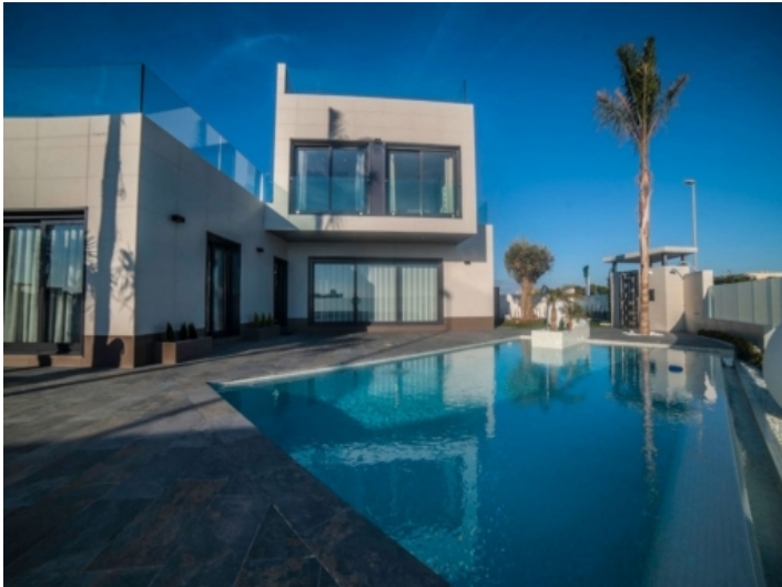
Großzügig geschnittener Poolbereich