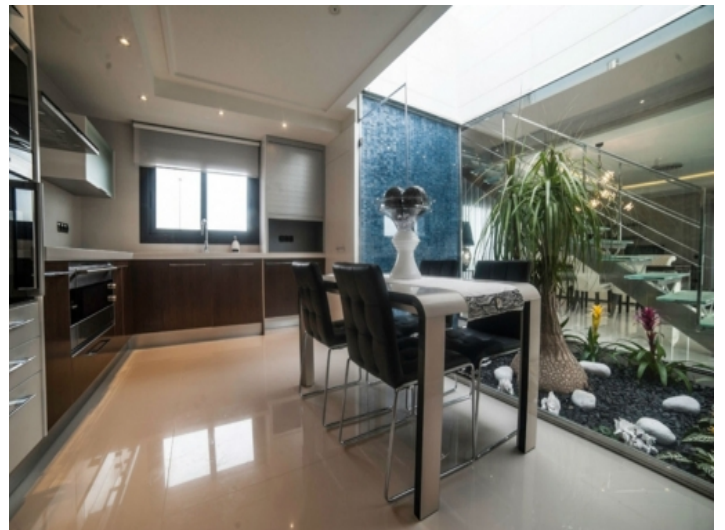
Moderne und voll ausgestattete Küche