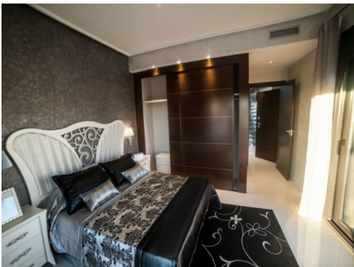
Schlafzimmer mit Doppelbett