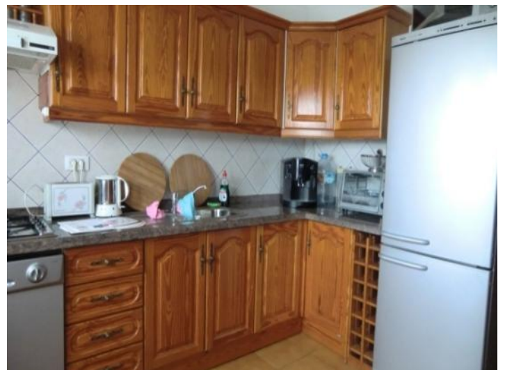
Fully equipped kitchen