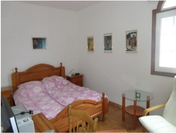
Another bedroom with large bed