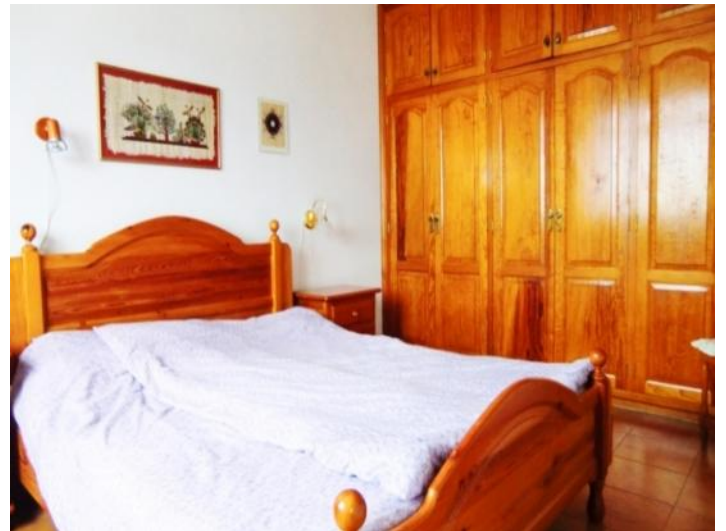
Bedroom with large fitted wardrobes