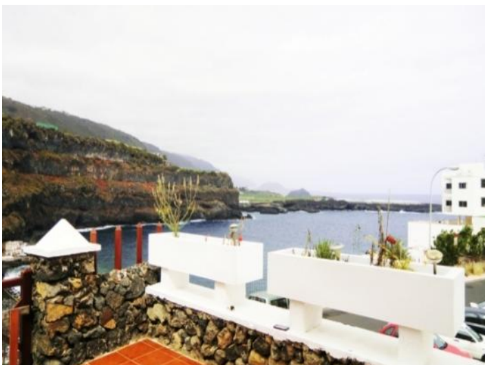
View of the bay of San Marcos