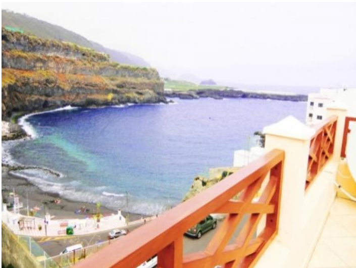
Stunning sea view from balcony