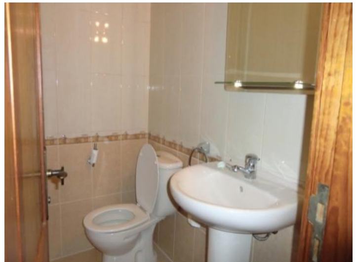
Guest toilet on the ground floor