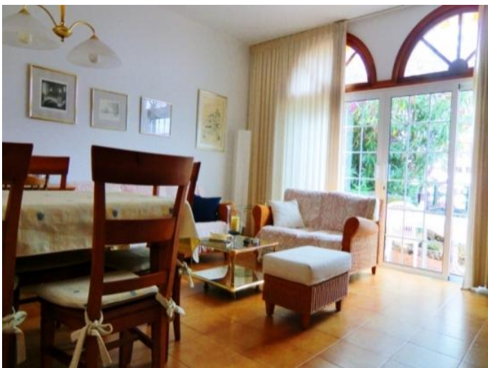
Bright living room with access to the terrace