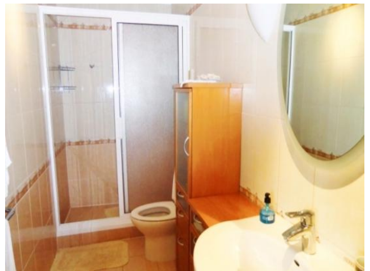
Bathroom with shower