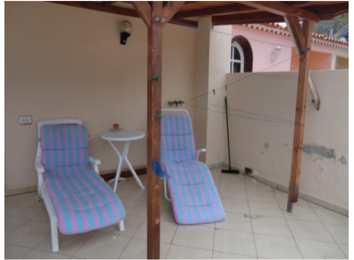
Covered terrace with sun loungers