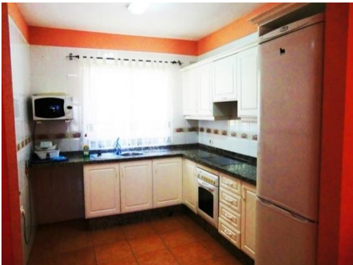
Fully equipped kitchen