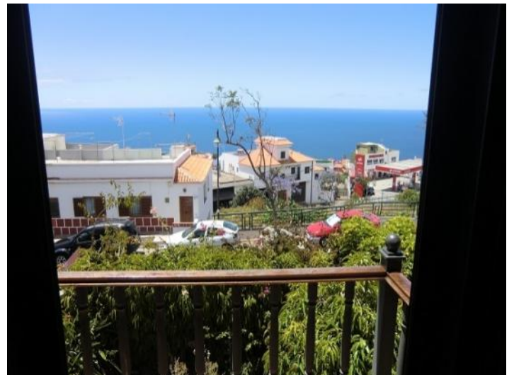
View of the Atlantic Ocean