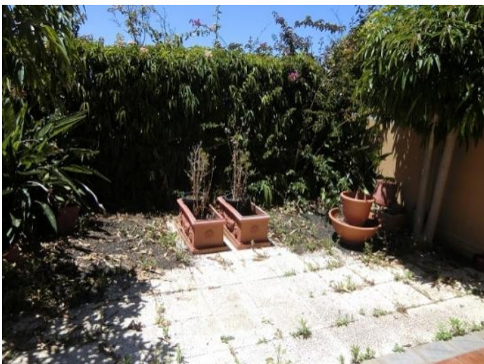
Terrace with garden