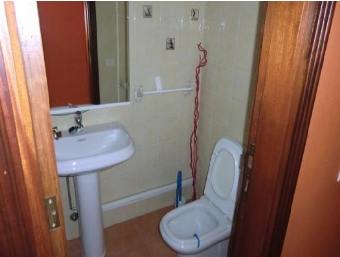
Bathroom with toilet