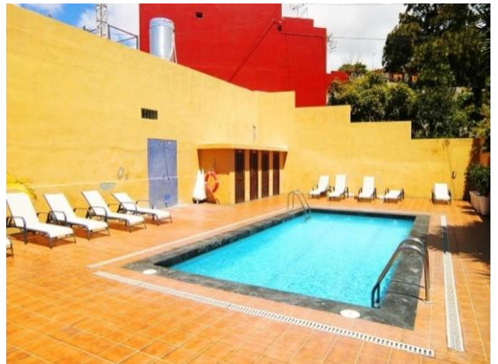
Pool with deck chairs