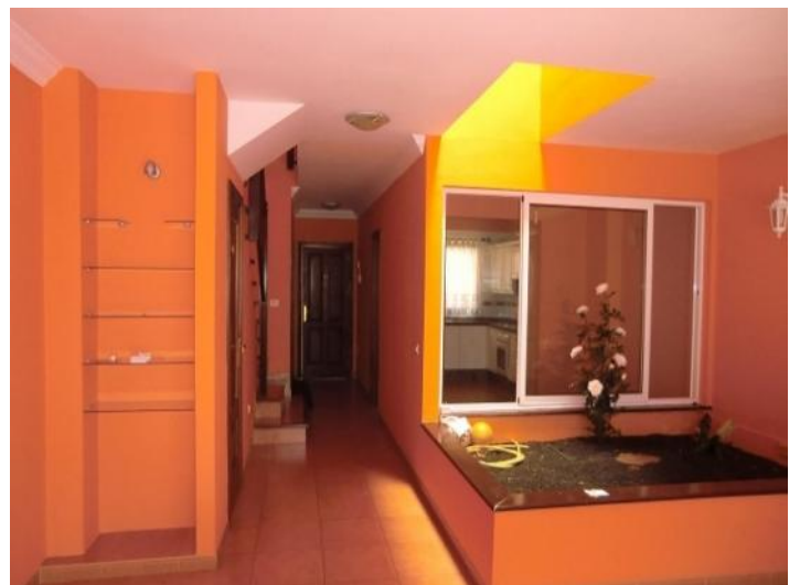
View through the hall to the kitchen and front door