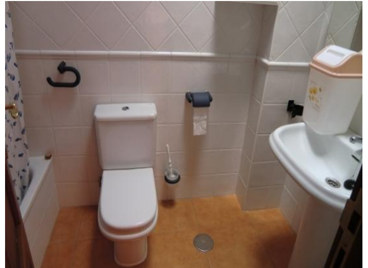
Bathroom with toilet and bathtub