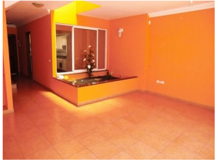
Spacious room with daylight