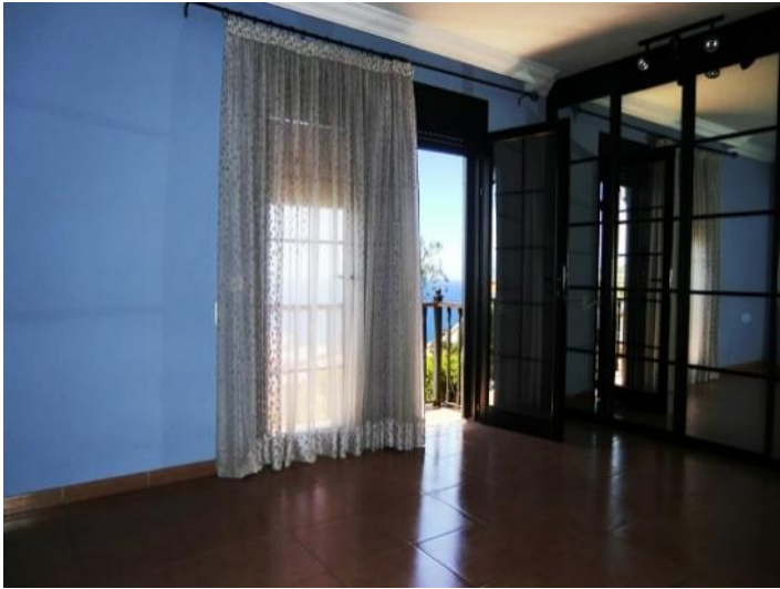
Bright room with access to the terrace