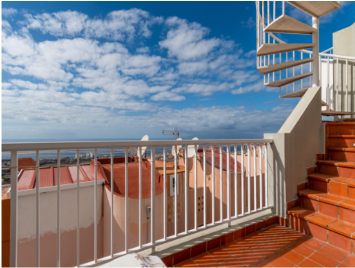
Blick von Balkon