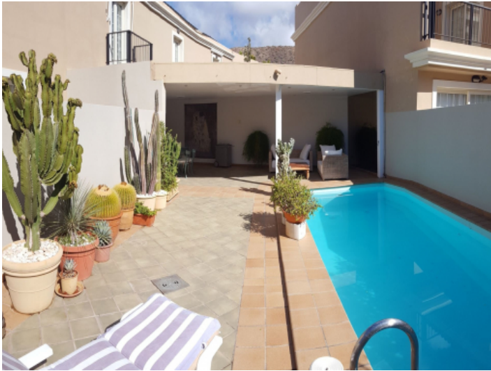
Haus, Palm Mar