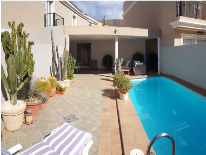
Haus, Palm Mar