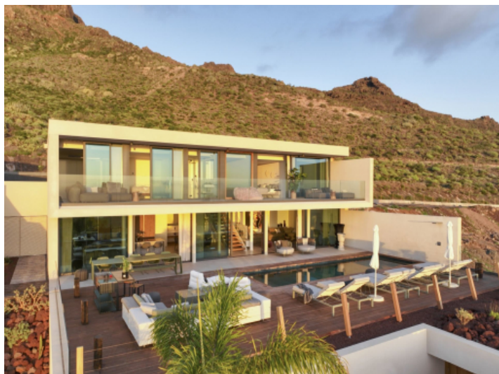
Moderne Luxusvilla mit atemberaubendem Meer- und