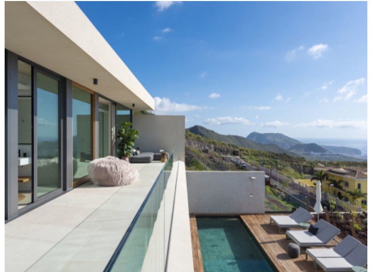
Balkon und Terrasse