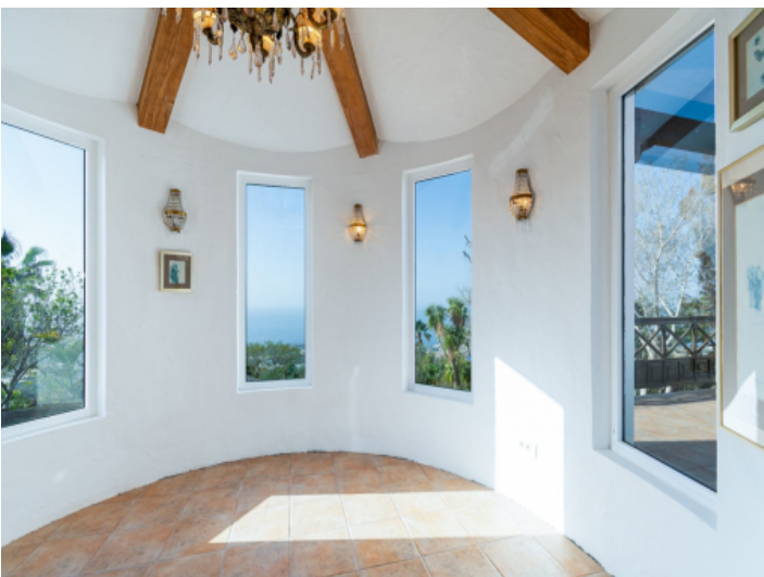
Essbereich mit Weitblick