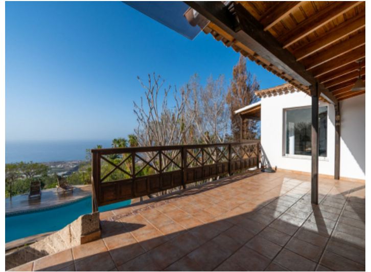
Terrasse mit Meerblick