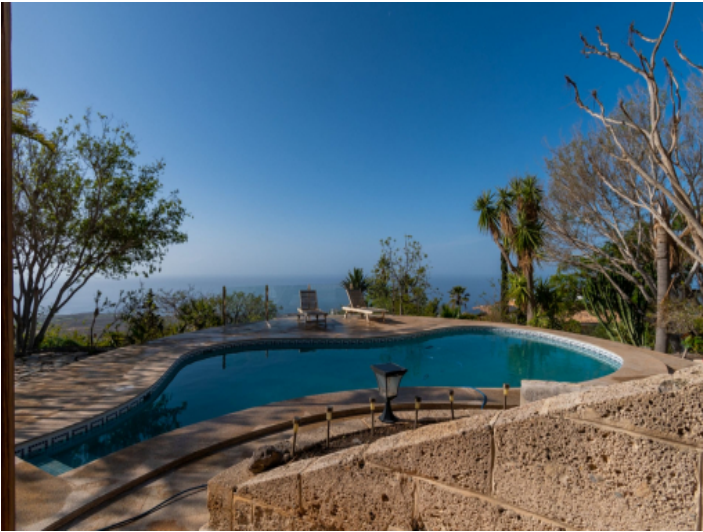
Pool und Meerblick