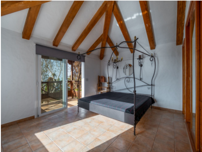
Eines von 4 Schlafzimmern