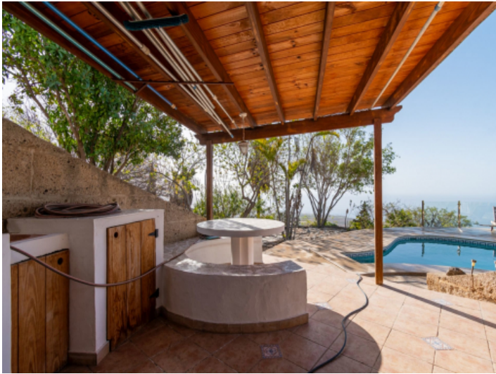
Terrasse mit Außenküche