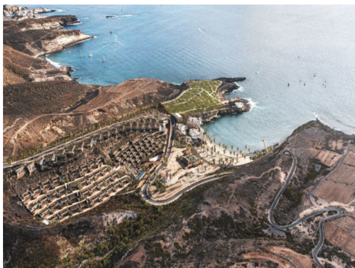
Blick aus der Vogelperspektive auf das Grundstück und den