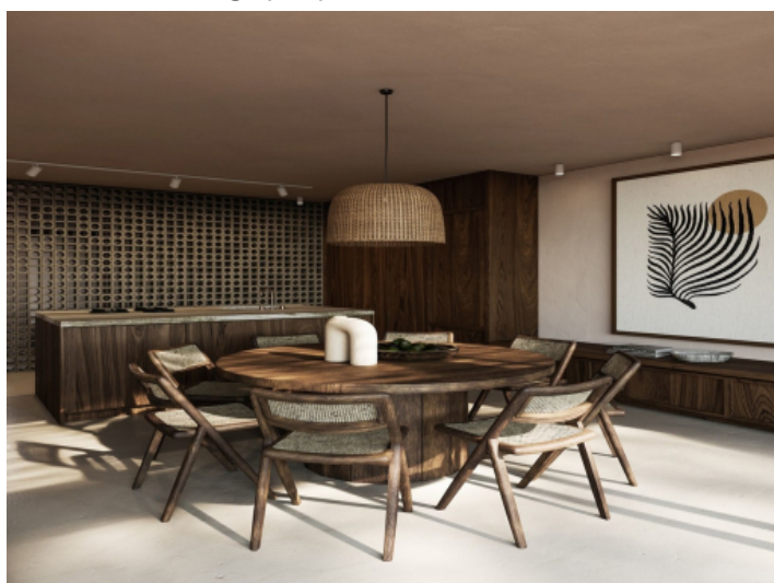
Küche und Essbereich