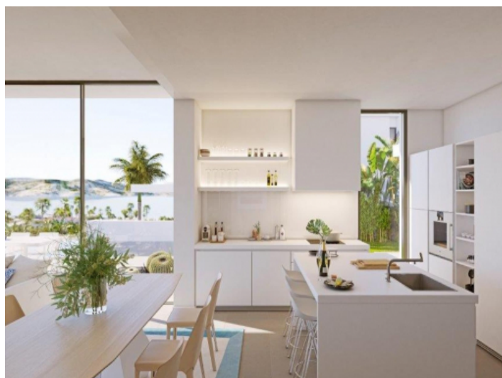
Moderne Küche mit Insel