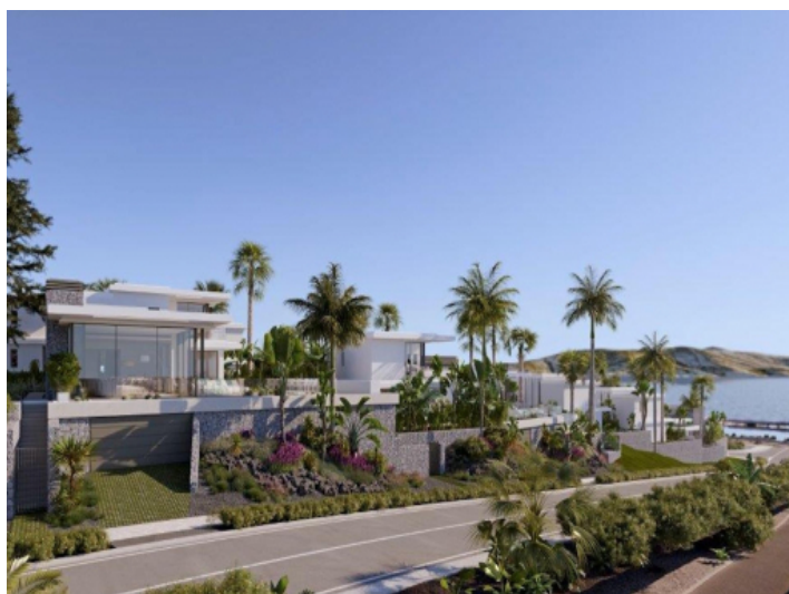
Außenansicht des Anwesens