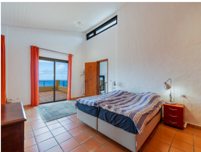
Eines von 6 Schlafzimmern