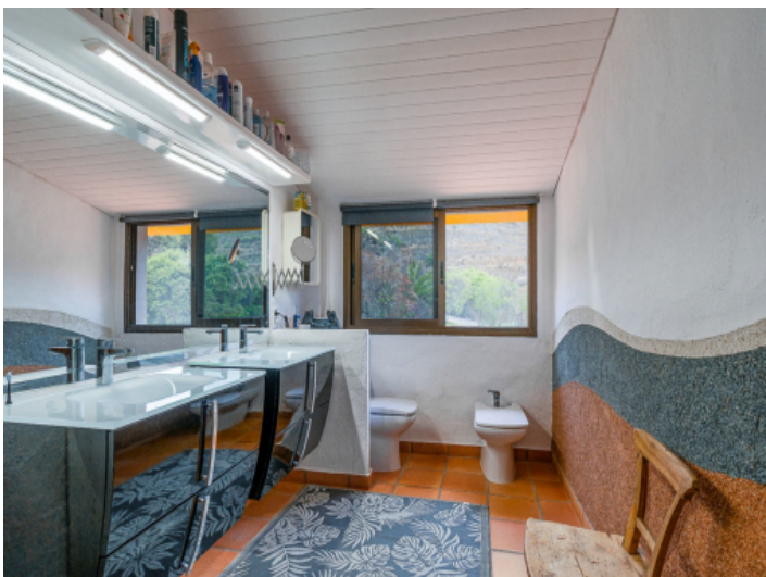
Villa mit 5 Badezimmern