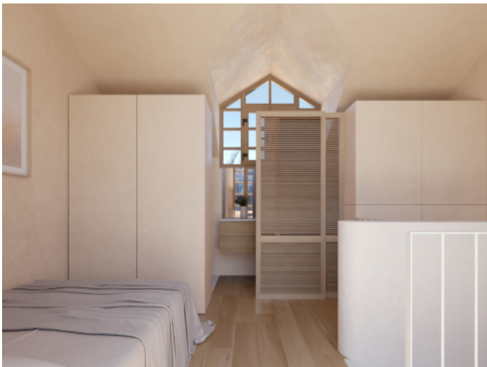
Schlafzimmer mit Badezimmer ein suite