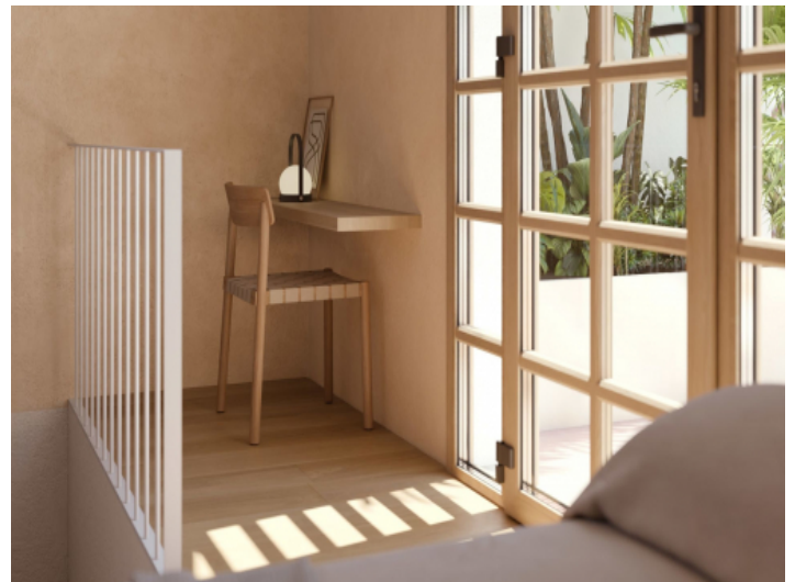
Schlafzimmer mit Arbeitsbereich