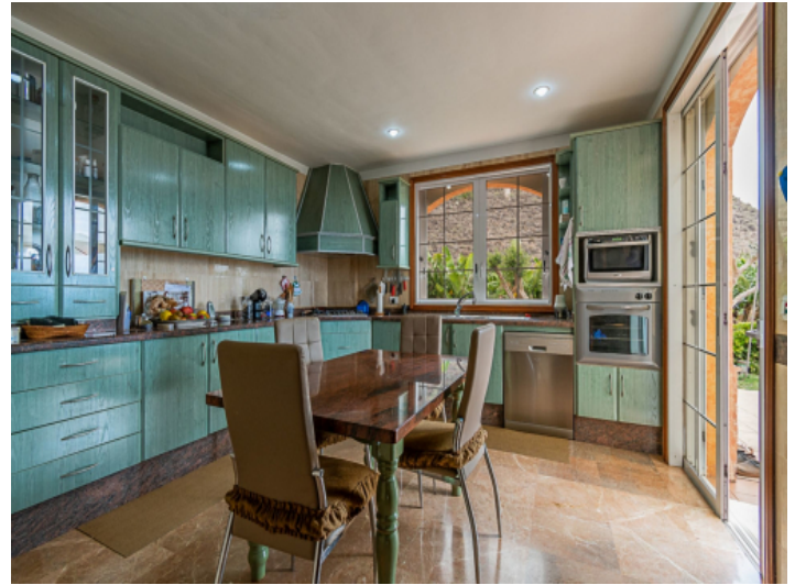
Küche und Essbereich