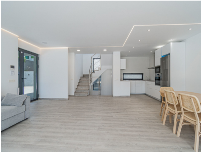
Essbereich und Küche