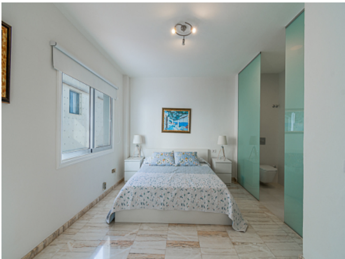
Gemütliches Schlafzimmer mit Badezimmer en Suite