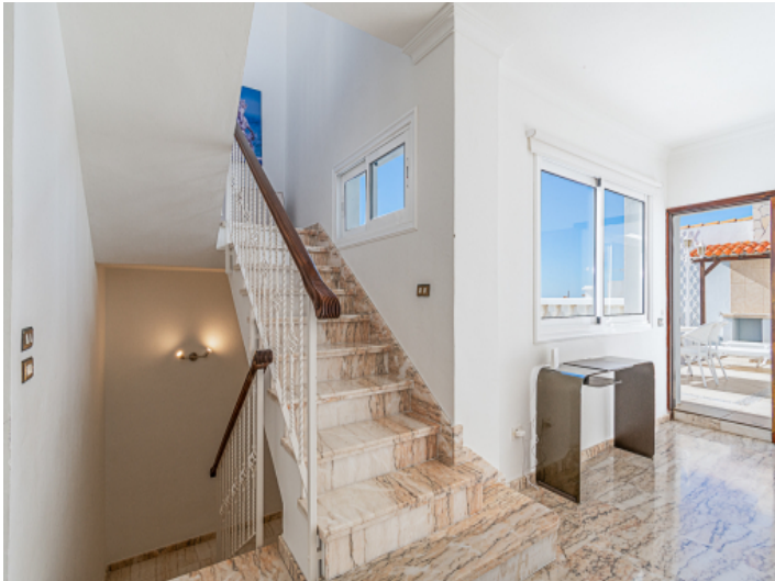
Eine Treppe führt in die verschiedenen Etagen des