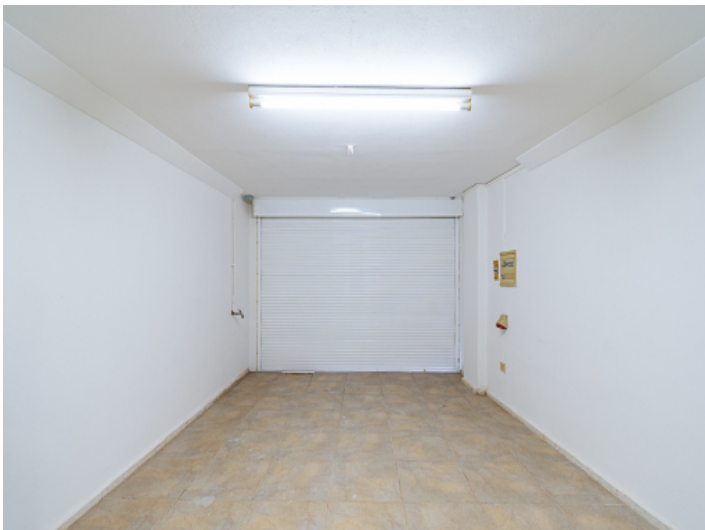
Garage des Stadthauses