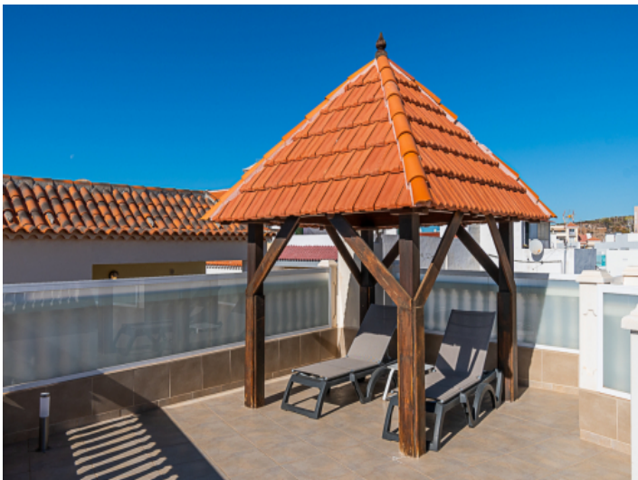
Terrasse mit Pavillon