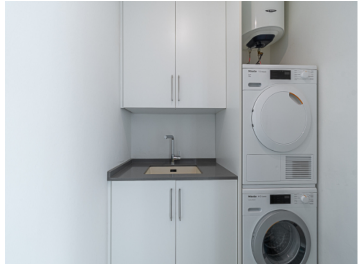
Hauswirtschaftsraum mit Waschmaschine und Trockner