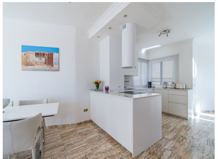
Offene Küche und Essbereich