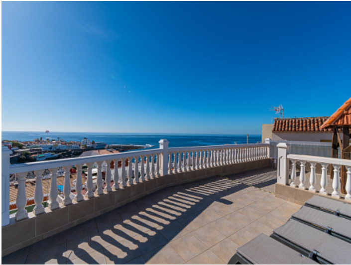
Einmaliger Meerblick vom Balkon