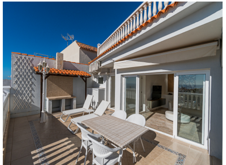
Essbereich auf der Terrasse