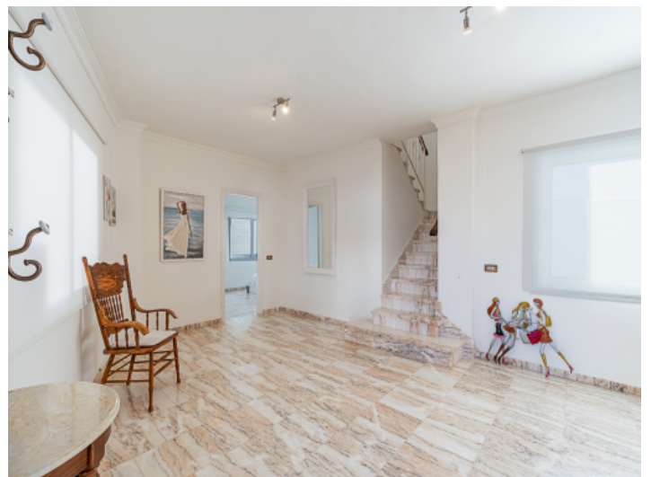
Eingangsbereich des Stadthaus