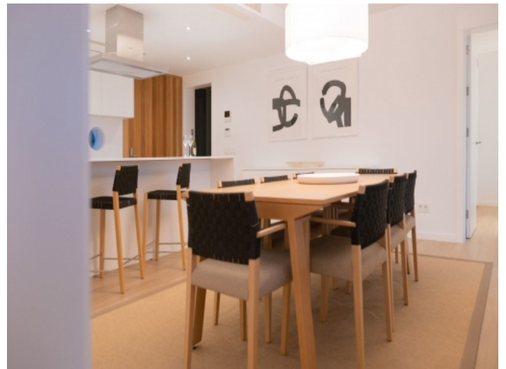
Schöner Essbereich mit angrenzender Küche