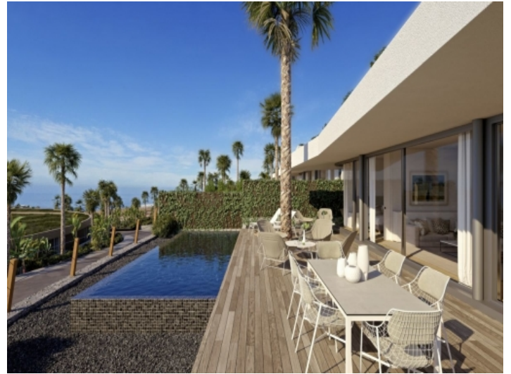
Geräumiger Aussenbereich mit Pool