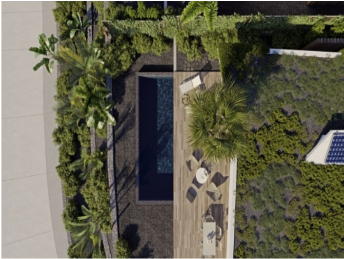
Ansicht von oben