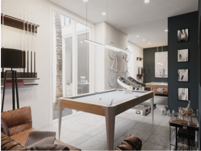
Büro und Hobbyraum