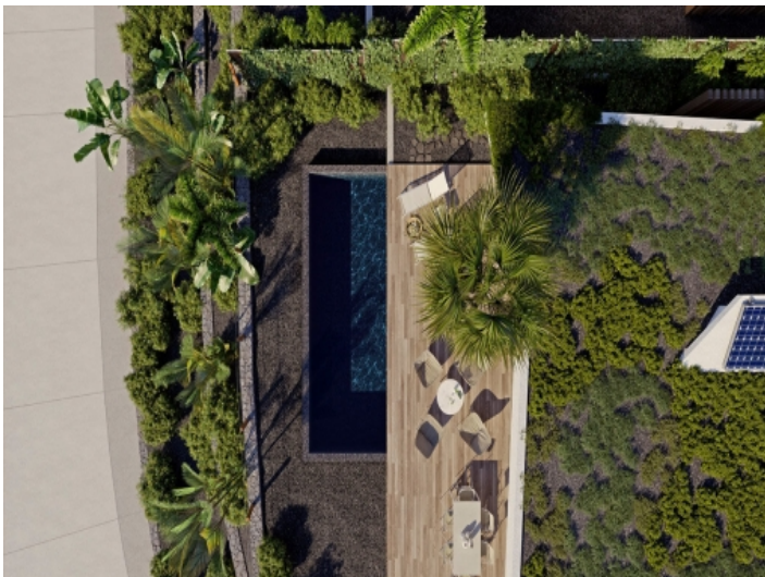
Die Villa aus der Vogelperspektive