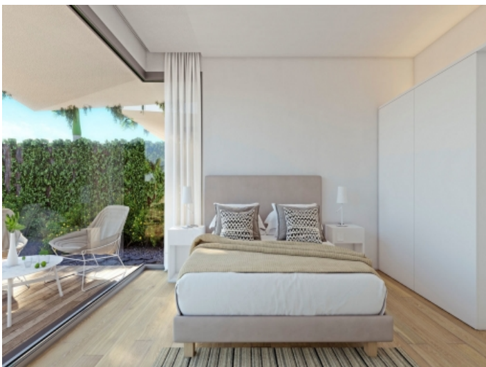
Schlafzimmer mit Panoramafenstern