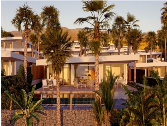
Der Wohnkomplex am Abend