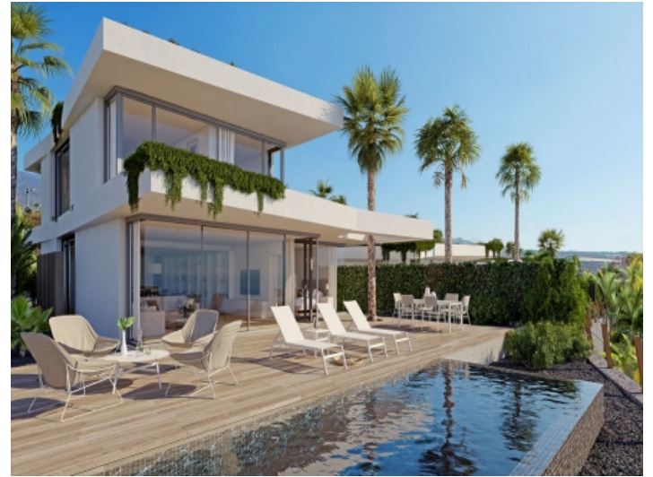
Einladender Poolbereich der Villa