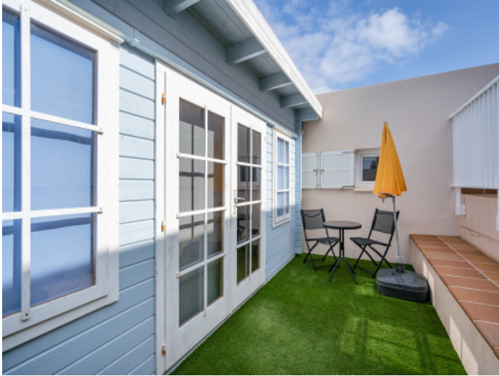
Gästehaus im Garten