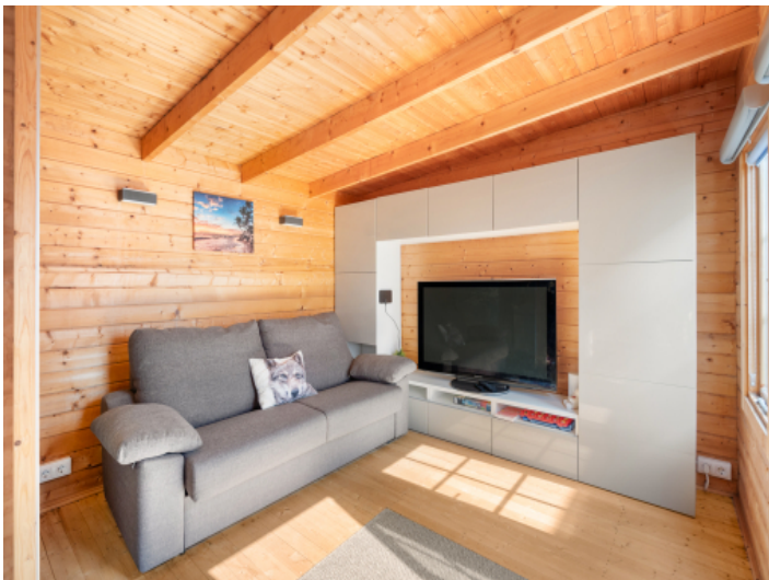
Wohnbereich im Gästehaus