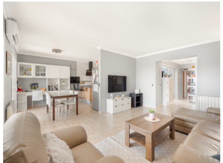
Halb offener Wohn- und Essbereich