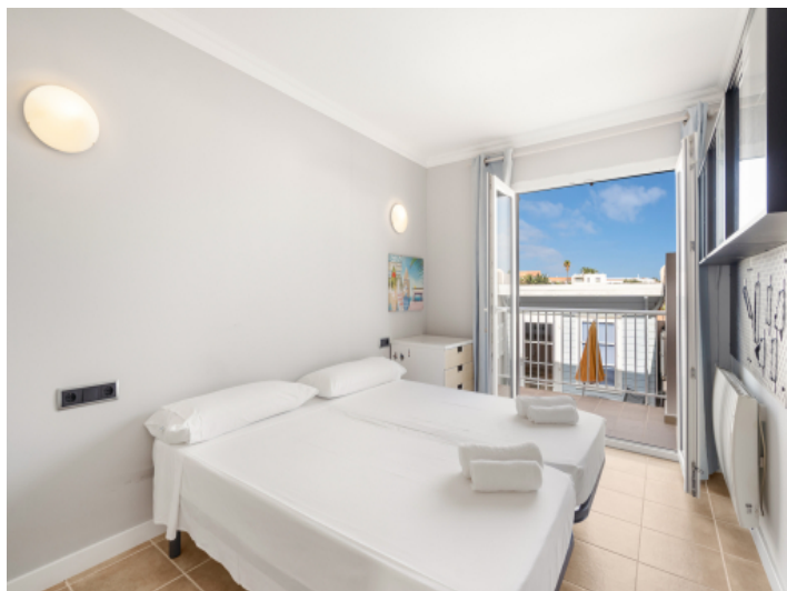
Eines von 4 Schlafzimmern