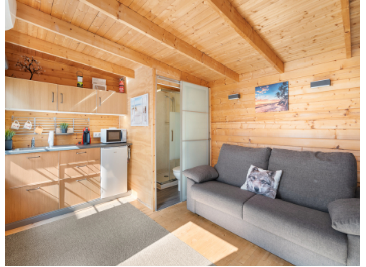
Küche und Wohnbereich Gästehaus