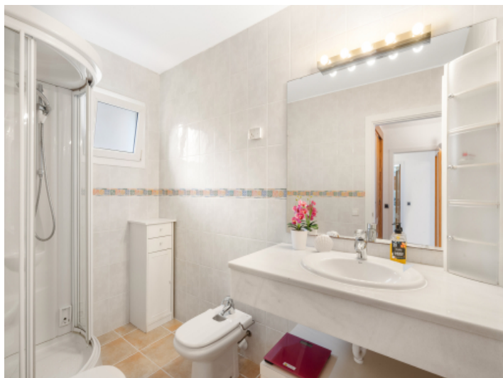
Eines von 3 Badezimmern