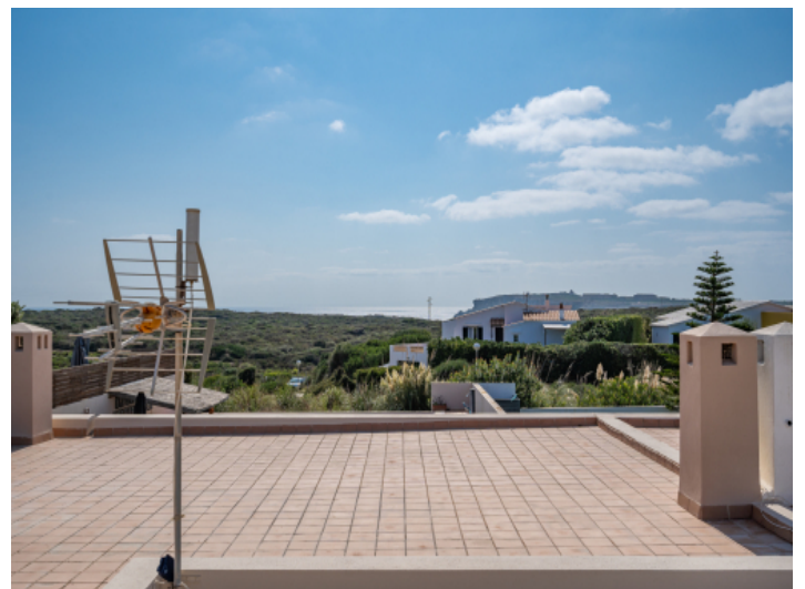
Dachterasse mit Blick bis Cala Llonga