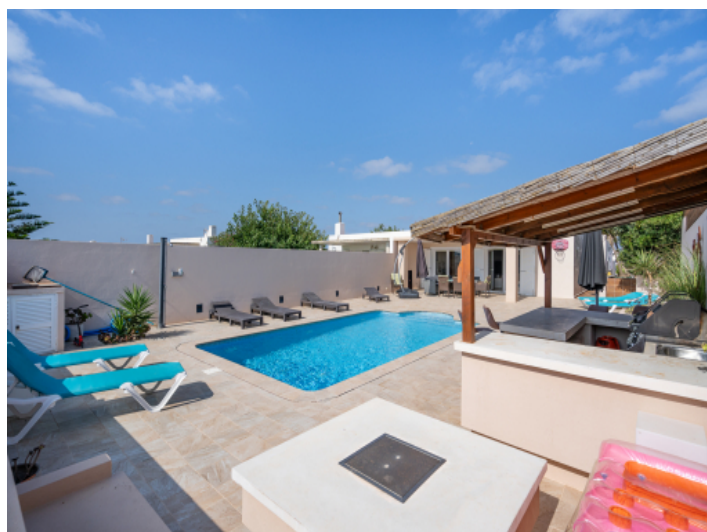
Pool und Grillbereich