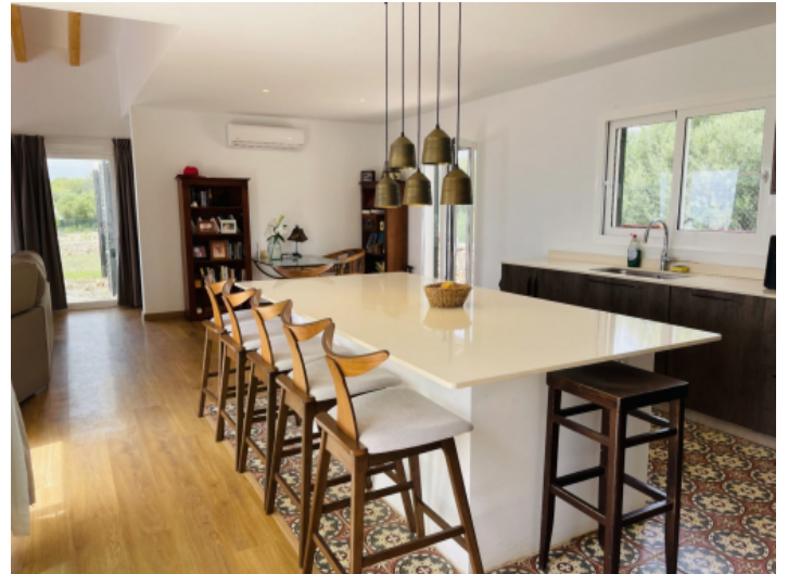
Essbereich und Küche