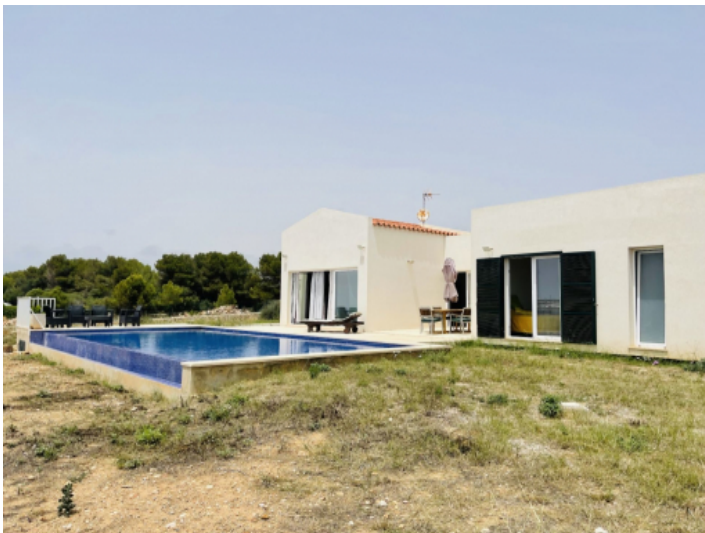
Ansicht auf das Haus