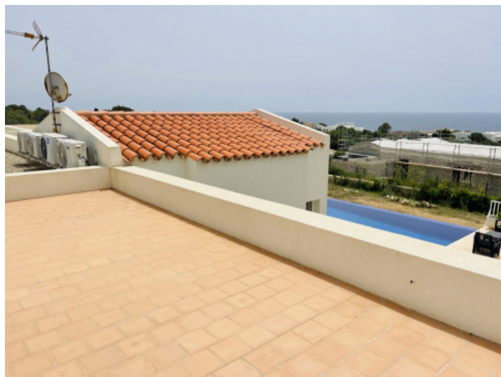
Dachterrasse mit Meerblick