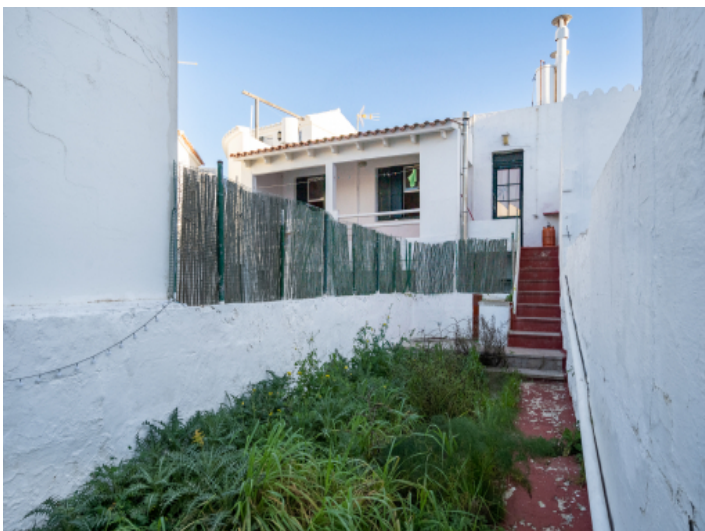
Stufen führen in den Patio / Garten