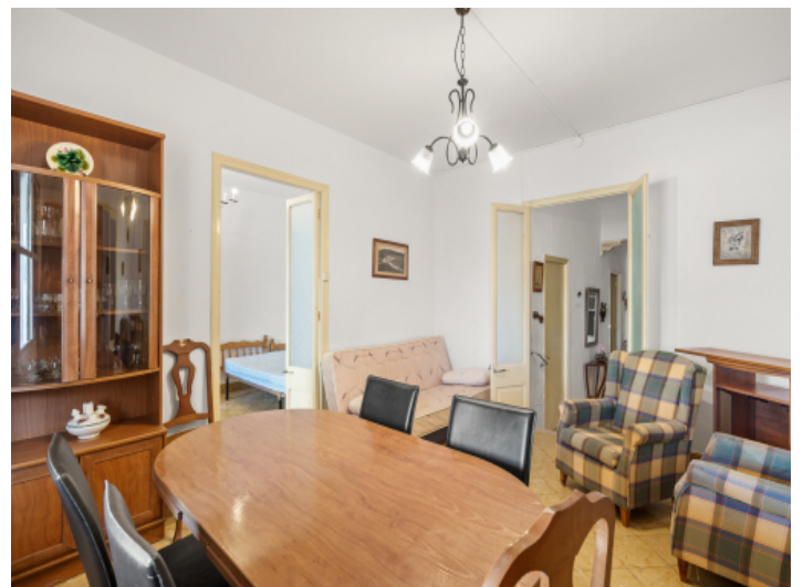
Blick zu einem Schlafzimmer und Flur