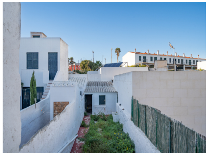
Patio / Garten mit separaten Lagerhaus