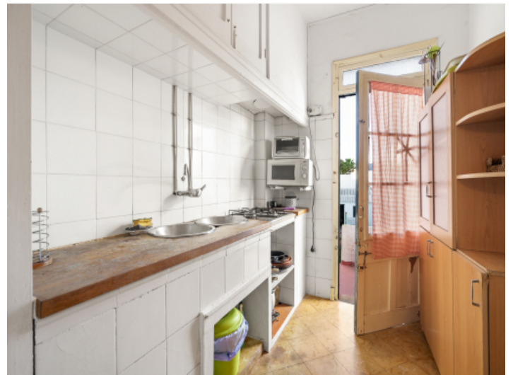
Küche mit Zugang nach Außen