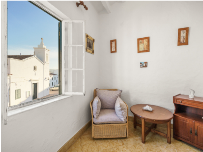
Schlafzimmer mit Kirchblick