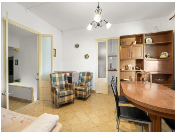
Wohn-und Essbereich mit Küchenzugang