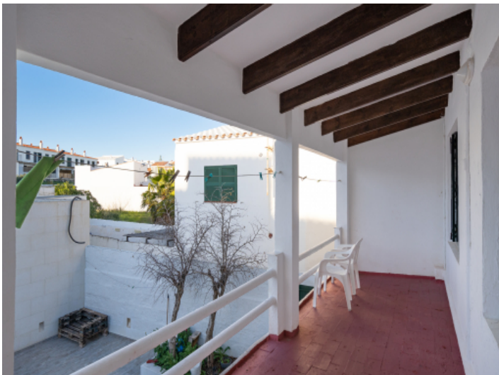
Terrasse mit viel Platz