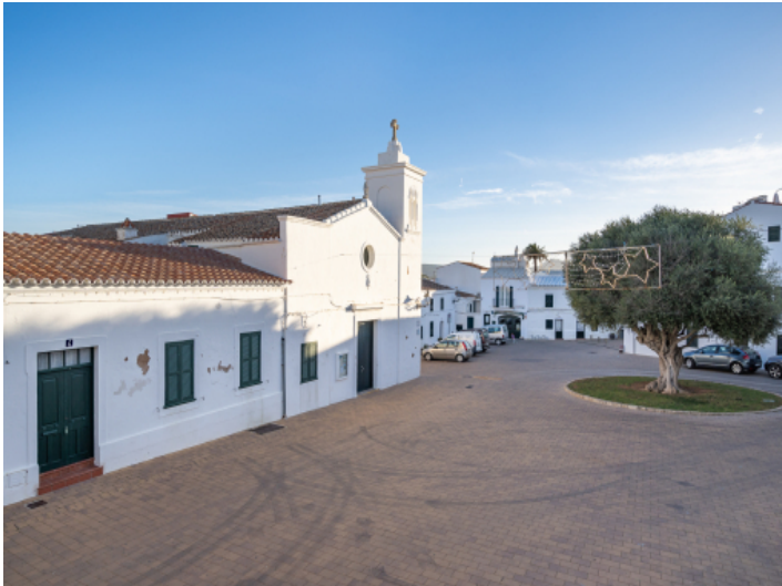
Blick zur Kirche von Fornells