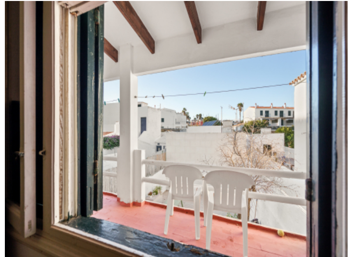
Schöne überdachte Terrasse